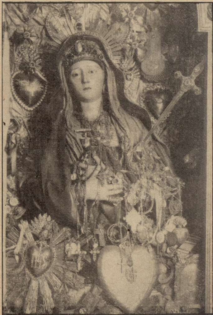
ID-DULURI TAL-KALVARJU jew L-OMM TAL-GHEĊUBIJET kif tissejjah għall-grazzji li taġhti, min-nies tal-Palestina.

meta bniedem ikun fl-ahħar nifs ta' hajtu, u kif niesu jitolbu quddiemha jghaddi għall-ahħar, u ftit wara jqum mill-friex, ma għandu xejn? Jew ta' meta xi hadd ikollu l-panni fuq għajnejh, u jkun għoddu ghama, u wara li jitlob quddiem din is-sura, il-ghilla tghaddilu u l-panni jmorru u jgiġi jara daqs min jara ċar?), in-nies ta'