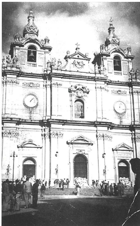
L-Arcimatriċi mbarrata bil-ġebel mill-Karkarizi minhabba li ttiehdu d-drittijiet tagħna il-Karkarizi.

L-Appell tiegħi imur lejn il-Karkarizi kollha speċjalment liż-zgħażaġħ, biex naħdmu halli dak li hallewlna missirijietna inżommuh u ngożżuh halli ngħadduh lil ta' warajna kif hadnih ahna. Nixtieq il-festa t-tajba lil kulhadd.