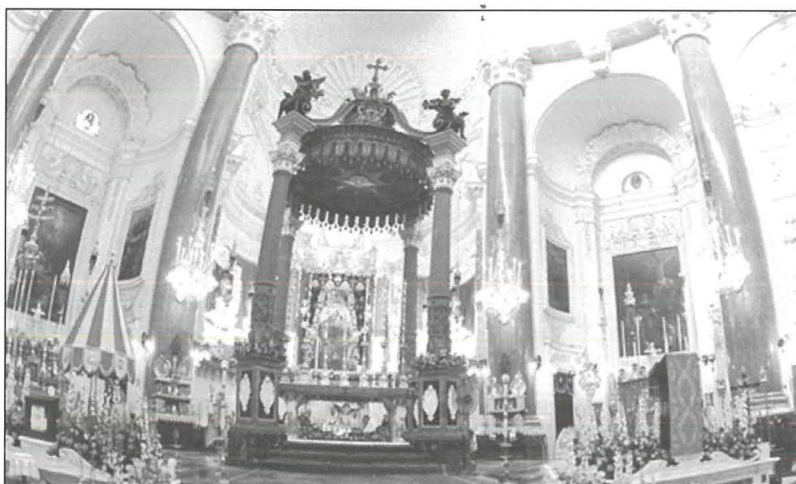
Il-knisja u d-dar tat-talb 'Lunzjata' fil-limiti tar-Rabat li nfetħet mill-ġdid it-Tnejn 9 ta' April, 2018