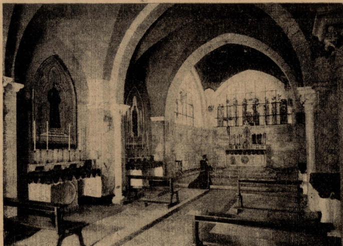
Knisja mibnija mill-Frangiskani fuq il-post, fejn kien imsawwat Gesù.

Dawk dahlu l-ghalqa u daru ma' Gesù. Ġuda resaq biesu u qallu dik il-kelma ekwivoka : "Salamtek, Rabbi!" San Pietru silet is-sejff, imma Gesù m'ingħu. Qallu: "Rodd sejfek f'ghantu, għax min ihareb, jithareb!" Jigifieri: min jagħmel gwerra mal-oħrajn, l-oħrajn jagħmlu gwerra mieghu . U dawk imbagħad rabtu lil Gesù u haduh.