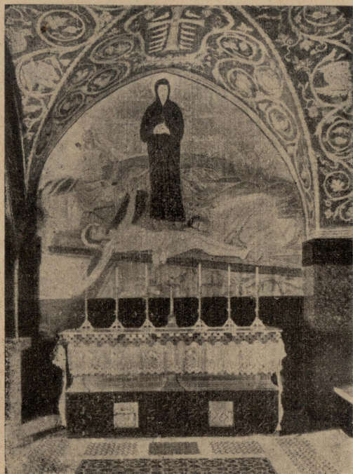
Kappella ta' -Frangiskani Fuq il-Blata tal-Kalvarju.

It-tislib kien l-agharr xorta ta' mewt li kienet tinghata fi żmien Roma. Kienet il-mewt li tinghata lilsiera li jagħmlu xi deni lil sjiethom u lil hallelin li jinqabdu jisirqu fit-