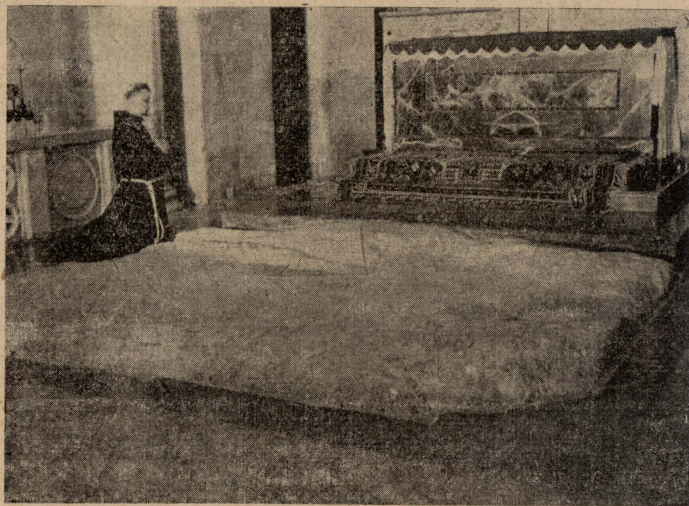
Il Blata tal-Agonija, ġewwa l-Bażilka tal-Ġetsemni.

Lil Ġesù dak il-hin qabdu biża' kbir. Biża' li jaqa' fuq kull bniedem qawwi shih meta jkun jaf li