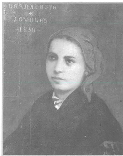
Bernardette Soubirous, ritratt meħud c. 1858

u sbuħija.” It-tielet strofa, imbagħad, tikkoncentra fuq ir-riglejn “ħafjin” tal-Madonna li kienu jistrieħu “fuq ix-xitla minn tal-ward” u li fuq kull rigel tal-Madonna kien hemm “warda minn tad-deheb l-iżjed fin.” Fir-raba' strofa, mir-riglejn ngħaddu għall-idejn tal-Madonna kif rathom Bernardina. Hawn naqraw li f'idejn il-Madonna kien hemm kuruna tar-rużarju li ż-żibeġ tagħha kien “abjad bħal-ħalib.” Il-preżenza ta' din il-kuruna f'id il-Madonna kellha sservi biex tfakkarna li “fir-rużarju l-għaxxa ssib.” Nistgħu ngħidu li din id-deskrizzjoni taqbel ma' dak li naqraw fl-ewwel dehra tal-Madonna lil Bernardina li seħhet fil-jum tal-Ħamis tal-11 ta' Frar tal-1858. 3