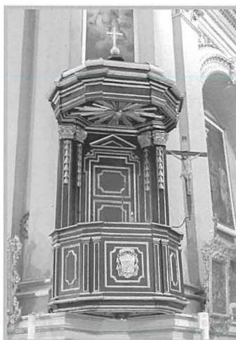
Giovanni Mamo, Pulpit, 1738-39, Injam tal-aħmar, 421x165x107 (maqtugħ mill-art 248), Parroċċa Santa Marija, Qrendi

Dan il-pulptu huwa maħdum mill-injam tal-aħmar flok mill-injam tal-ġewż, liema injam kien meqjus aktar sinjur 10 u allura kien aktar imfittex fil-manifattura ta' dawn l-opri. Dan seta' sar biex jonqsu l-ispejjeż, wara l-ispiza enormi li kienu daħlu għaliha l-Qrendin biex bnew