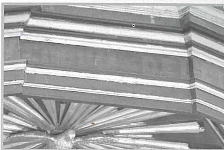
Il-pożizzjoni fejn kienet imwaħħla l-iskrizzjoni BEATI QUI AUDIUNT VERBUM DEI ET CUSTODIUNT ILLUD

Il-kontorn tal-gallerija tal-pulpu hi ta' skorfini, b'ħames faċċati sporguti 'l barra mill-pilastru u tlieta oħra li jakkompanjaw l-istess pilastru. Differenti minn pulpti oħra tal-istess stil, il-gallerija mhux qed isserraħ fuq saljatura, iżda fuq il-pedestall li minn fuq jibda l-imsemmi pilastru. Il-ħames faċċati huma mżejna b'panewijiet bil-gwarniċi, filwaqt li l-arma tal-Arcisqof Paolo Alphéran de Bussan (1728-1757), li fi żmien sar il-pulptu, tidher prominent fuq il-faċċata prinċipali. Il-ħames faċċati huma akkumpanjati b'par pilastru stil Tuscan u fuq kollox hemm entablatura li sservi ta' poġġaman. Ġol-gallerija hemm magħqad biċ-ċappetti fuq naħa waħda biex ikun jista' jitlea u jinzel. Dan kien jintuża bħala banketta għall-predikatur meta l-prietki kienu jtaflu.