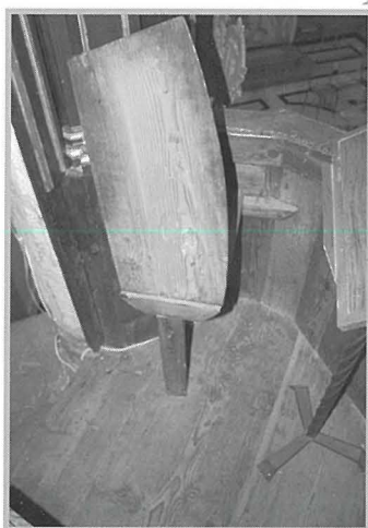
Il-magħqad ġol-gallerija li kien jintuża bħala banketta għall-predikatur.