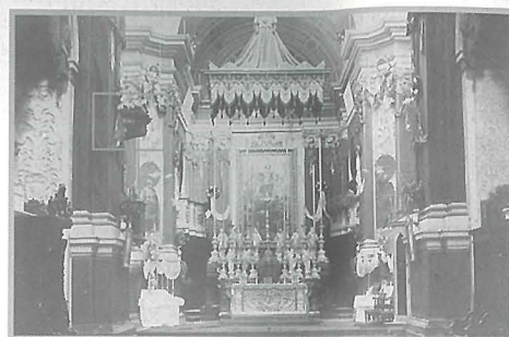
Ritratt meħud fl-1928 f'għeluq il-ħamsin anniversarju mit-twaqqif tal-Konfraternità tal-Beata Vergni Immakulata ta' Lourdes fil-Qrendi, fejn il-kelma BEATI għadha legġibli.

entablatura kien hemm imwaħħla skrizzjoni bil-Latin 'BEATI QUI AUDIUNT VERBUM DEI ET CUSTODIUNT ILLUD', li bil-Malti tfisser IMBERKIN DAWK LI JISIMGHU L-KELMA T'ALLA U JHARSUHA. (Luqa 11, 28). Din l-iskrizzjoni kienet tneħħiet matul iż-żminijiet, x'aktarx fis-sebghinijiet. Fil-fatt, ritratt antik tal-knisja li jgħid id-data 1928, u li fih jidher il-pulptu, għadek tista' taqra parti minnha.