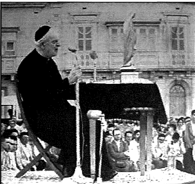
San Ġorġ Preca waqt Sajda Mużewmina

Dun Ġorġ ukoll, huwa u jimmedita fuq il-kobor tas-setgħa ta' Marija li hija rċeviet minn Alla, kien iħoss