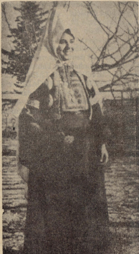
Ilbies ta' mara Betlemita.

Fil-jiem ferrieħa tal-Milied u tat-Tre Rē, moħħua, irid jew ma jridx, jittajjar f'dak l-imkien li fih twieled Ġesù. Jinstama' fuq kull xufftejn l-isem ta' Betlehem, li hu l-istess "ferħ