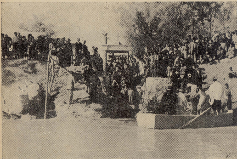
Fejn għammed San Ġwann.

L-istorja tal-Ġurdan tintiseġ kolha kemm hi mal-missjoni ta' San Ġwann Battista. San Ġwann beda il-ministeru tiegħu fid-deżert tal-Ġudea (1) Lejh resqu n-n'ies ta' Ġerusalem u ta' kollha kemm hija l-Ġudea u tal-pajjiżi ta' ma' dwar il-Ġurdan, bex jiġu minnu mghammda