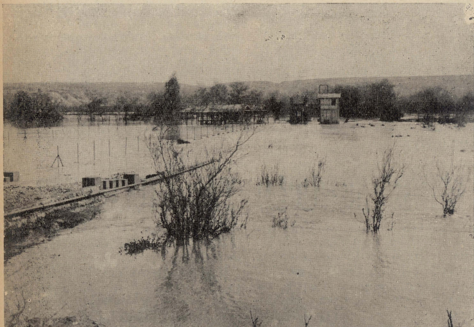
Ix-xmara tal-Gurdan imfawra.

kappella u ospizju għall-pellegrini; il-monument l-ieħor jikkonsisti f'bini ma' ġenb ix-xtajta tax-xmara magħmul minn altar sempliċi mghotti b'Baldakkin tal-ġebel u taraġ li minnu wiehed jista' jinżel sal-ilmijiet tax-xmara. Fl-1956 il-Missjoni tat-Terra Santa hasbet li tirraġa l-monument mibni fuq ix-xtajta. Tneħħa l-concrete kollu li kien jgħatti l-kappella, inżammew il-kolonna u ġew miksija bil-ġebel u fuqhom inbniet daqsxejn ta' koppla.