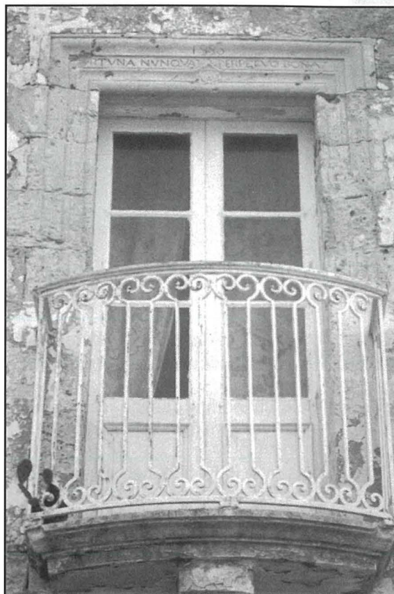
Il-gallerija fi Pjazza Mesquita fl-Imdina li wkoll fiha skriżżjoni bħal dawk imsemmija li jinsabu f'Birkirkara u fi bnadi oħra ta' Malta u barra.