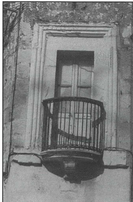
Il-gallerija fl-iskrizzjoni fuq il-blata tal-bieb tagħha, li tinsab fi Triq il-Kbira kantuniera ma' Triq San Guzepp, hdejn l-Għassa tal-pulizija.

U kien propju biex iderri ftit mit-taħbit tal-ħajja ta' kuljum li Verdala bena dak il-palazz u għamel il-masġar madwaru li għadna ngawduh sa llum.