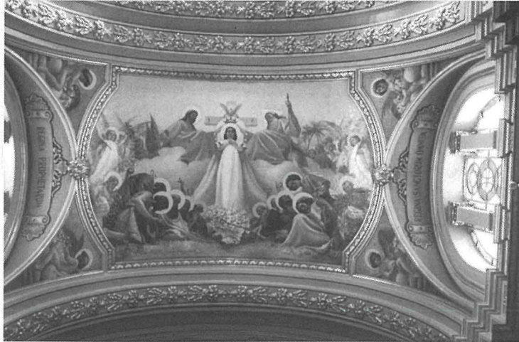
Parti mis-Saqaf tas-Santwarju