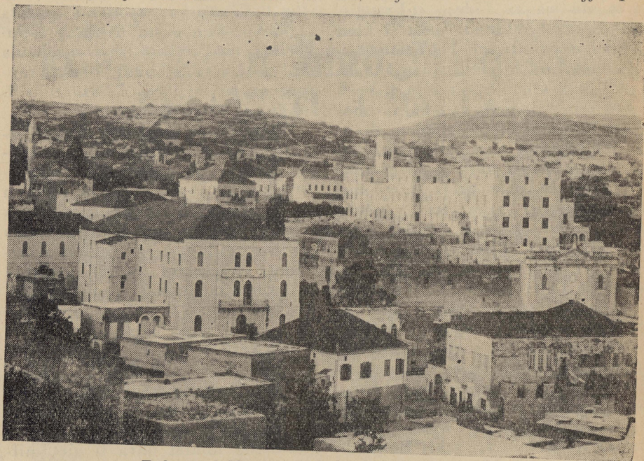
Dehra ta' Nazaret qabel ma nbriet il-Bazilika.

il-darba 'ma jghinx biex jinzamm haj l-ispirtu ta' talb u ta' tjieba. u dan bi nhar u bil-lejl, kif jitlob cerimonjal miktub ghal tapposta ghal Nazaret mill-Kustodju Patri Tumas Obicini. Niehu pjaeir infakkarkom kif fil-pellegrinagg tieghu ta' l-1964 il-Papa Pawlu VI xandar messagg, sewwasew minn Nazaret, messagg ta' spiritwalita liema bhalha, li juri kif ahna mill-hajja qad-