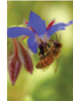
Naħla tirgħa fuq fjura tal-Fidloqqom

Ċentru ta' Riċerka u Żvilupp L-Għammieri, Triq l-Ingiered Il-Marsa MRS 3303