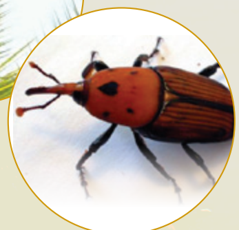
Bumunqar Aħmar Adult