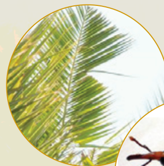
Sintomi ta' siġra infettata

Kif rajna, għadu ma jeżistix metodu effiċjenti biżżejjed biex jelimina l-Bumunqar Aħmar tal-Palm mill-bidu. L-importanza ta' kontroll ta' dan l-insett fl-Ewropa hija waħda kbira, speċjalment fir-reġjun tal-Mediterran, u għaldaqstant il-pajjiżi tal-Unjoni Ewropea daħħlu numru ta' miżuri. Fost dawn ta' min isemmi li kull wieħed minna huwa fl-obbligu li meta jara xi palm marid jew suspettat li hu marid, iridu jiġu infurmati mill-ewwel l-awtoritajiet Maltin. Dan jista' jsir billi nċemplu lid-Dipartiment għas-Saħħa tal-Pjanti fuq 2339 7545 jew 2590 4312 għall-kontroll ta' dan l-insett.