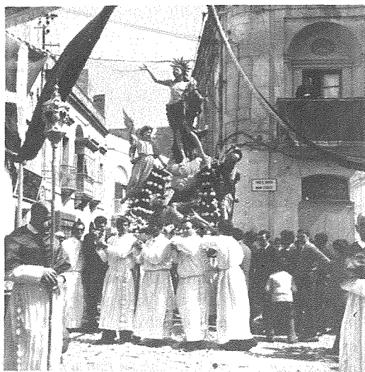
L-istatwa ta' l-Irxox t fil-purċissjoni tal-Għid fil-bidu tas-snin sebghin.