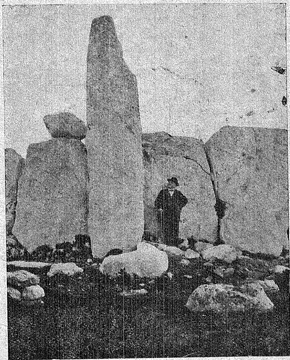
HAGAĠ QI'M — L-OGĦLA PLIER

Maqtugħa minn sodditha, mill-ġnieb u minn taħt, il-ħaġra kienet tkun imhejjija għall-ġarr. Biex iqanqluha kienu x'aktar jimlew it-trinka bi bċeġjeċ tal-ġhuda niexfa li jitbillu wara, għax il-ġhuda mita tixrob l-ilma tismen u titfa' l-barra u taqsam kull ma ssib quddiemha. Zokk ta' siġra kien ukoll jagħmel lieva u jqanqal il-ħaġra maqtugħa minn l-art.