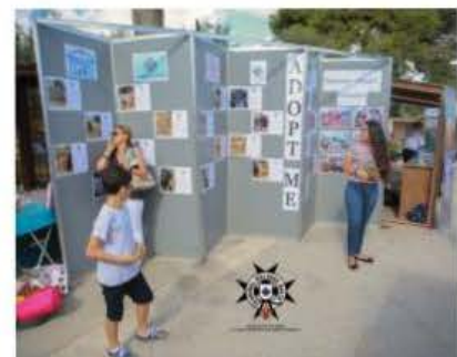
Stand tal-adozzjoni tal-animali