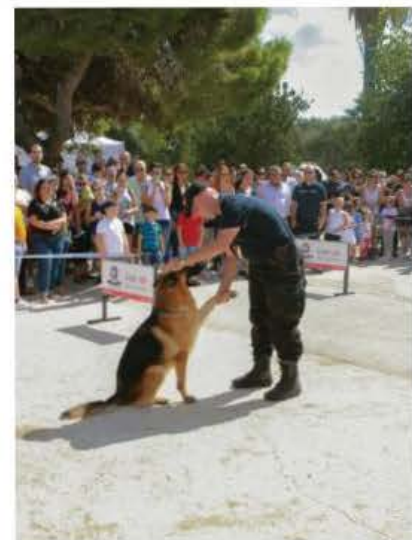
Wirja tal-klieb tal-pulizija