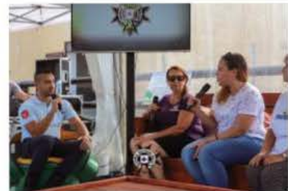
Żona ta' diskussjoni