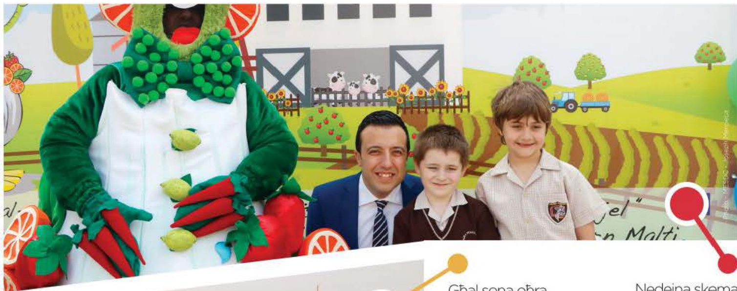
Imagh Maltin