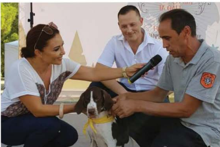
Wieħed mill-klieb għall-adozzjoni waqt l-attivit tal-animal awareness day