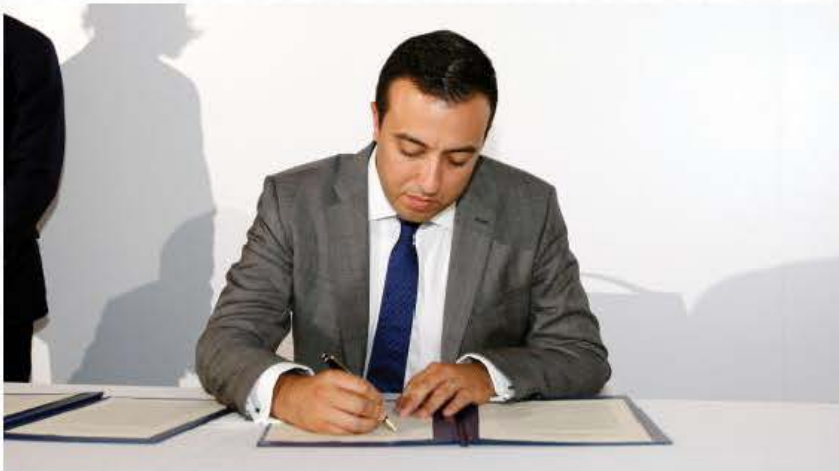
Iffirmat l-ewwel pjan ta' azzjoni reġjonali għas-sajd artiġjanali fil-Mediterran u l-Baħar l-Iswed

F 'Settembru li għadda diversi Ministri responsabbli mis-settur tas-sajd iltaqgħu għewwa l-Mużew Nazzjonali tal-Arkeoloġija fil-Belt Valletta għall-konferenza dwar is-Sajd Artiġjanali sostenibbli fil-Mediterran u l-Baħar l-Iswed. Waqt konferenza stampa, is-Segretarju Parlamentari għall-Agricoltura, Sajd u Drittijiet tal-Annimali Clint Camilleri qal li din "hija ġurnata importanti fejn għall-ewwel darba għadu kif gie ffirmat l-ewwel pjan ta' azzjoni reġjonali għas-sajd artiġjanali fil-Mediterran u fil-Baħar l-Iswed."