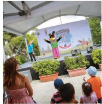
Divertiment għall-familja kollha