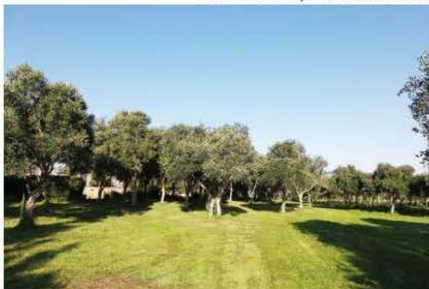
Masġar ġewwa Ta' Qali