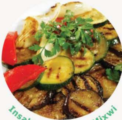
Insalata bil-Haxix Mixwi

Importanti hafna li l-haxix kollu speċjalment il-hass ikun tqattar sew; għalhekk jew tuża vegetable spinner, jew inkella tpoġġi l-haxix fuq karti ħoxnin li tuża fil-keċina. Jekk il-haxix ikun għadu mgħobbi b'hafna ilma allura l-ebda dressing ma jaqbad miegħu.