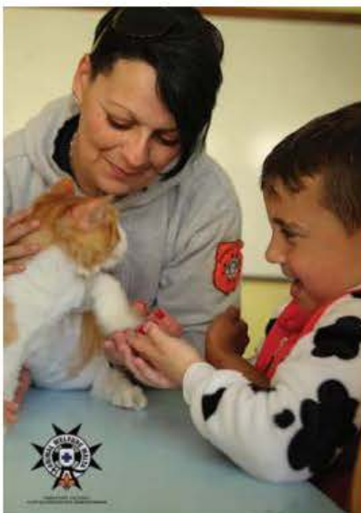
Attività mat-tfal rigward il-harsien tal-annimali