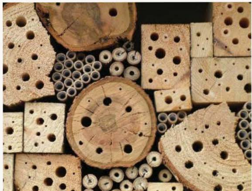
Xehda magħmula mill-bniedem