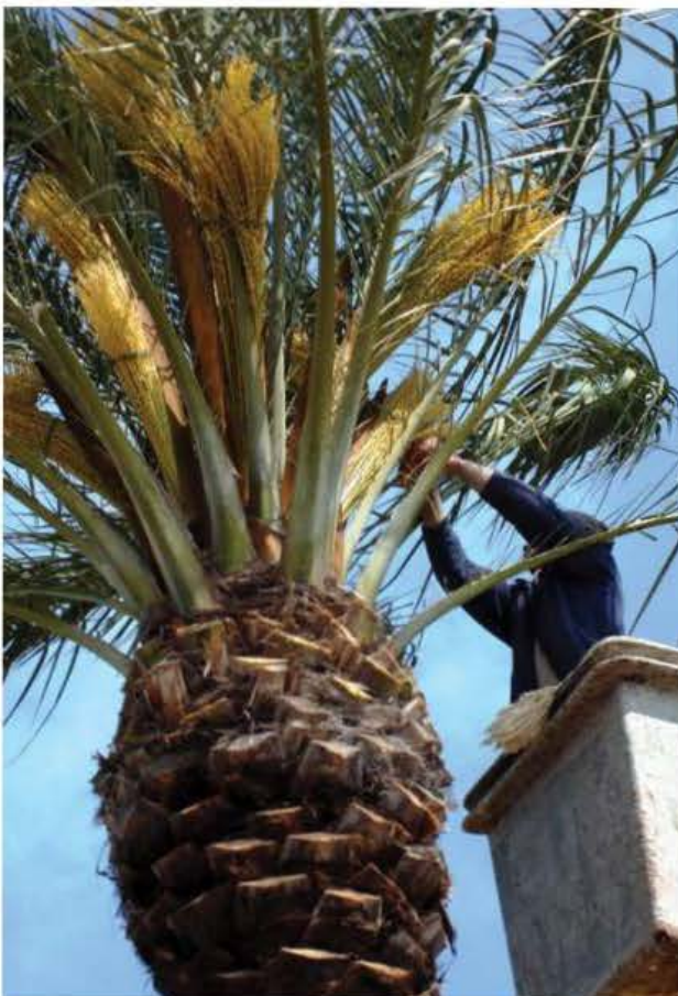
Floriana - Biskuttin

Id-dakra trid issir manwali meta l-għenieqed fuq is-siġra mara ma jkunux għadhom fethu l-fjuri.