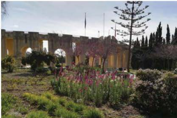
Il-Park Nazzjonali ta' Ta' Qali

Il-hidma fuq dawn is-servizzi se tkompli għaddejjja sabiex ikunu aktar informattivi fir-rigward ta' speċi ta' flora u fauna li jinsabu fis-siti amministrati minn Ambjent Malta. Dan ukoll jgħin sabiex ikun hemm aktar għarfien u edukazzjoni dwar il-hidma li għaddejjja sabiex dawn is-siti jiġu protetti u mħarsa.