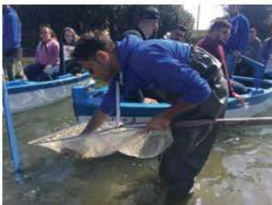
Produzzjoni ta' gandoffli ġewwa Ganzirri Lake (Lago Grande)

tal-ewwel li tkabbar dawn il-gambli fi Sqallija, tiffoka fuq it-tkabbir ta' din l-ispeċi, bil-għan li l-prodott jinbiegħ lill-hwienet u lir-restoranti tal-viċin. L-istudenti żaru l-post fejn jtkabbru dawn l-ispeċi minn meta jkunu frieħ, sa ma jinbiegħu fis-suq. Waqt li kienu f'dan ir-reġjun, l-istudenti tgħallmu wkoll dwar il-produzzjoni tal-papiru ( Papyrus ), li hija tip ta' karta ħoxna li fl-antik kienet tintuża flok il-karta li nużaw illum il-ġurnata. Fl-aħħar nett, l-istudenti żaru nursery tal-pjanti - intrapriża li tiproduċi mat-300,000 pjanta tal- bougianvillea għall-esportazzjoni.