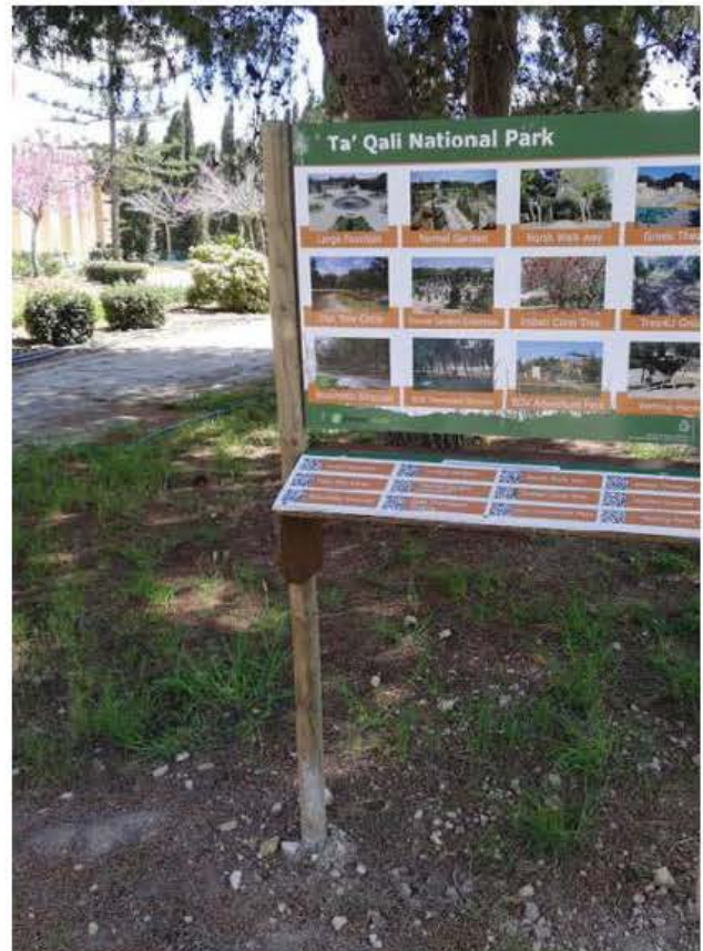
Tabella ta' informazzjoni ġewwa Ta' Qali