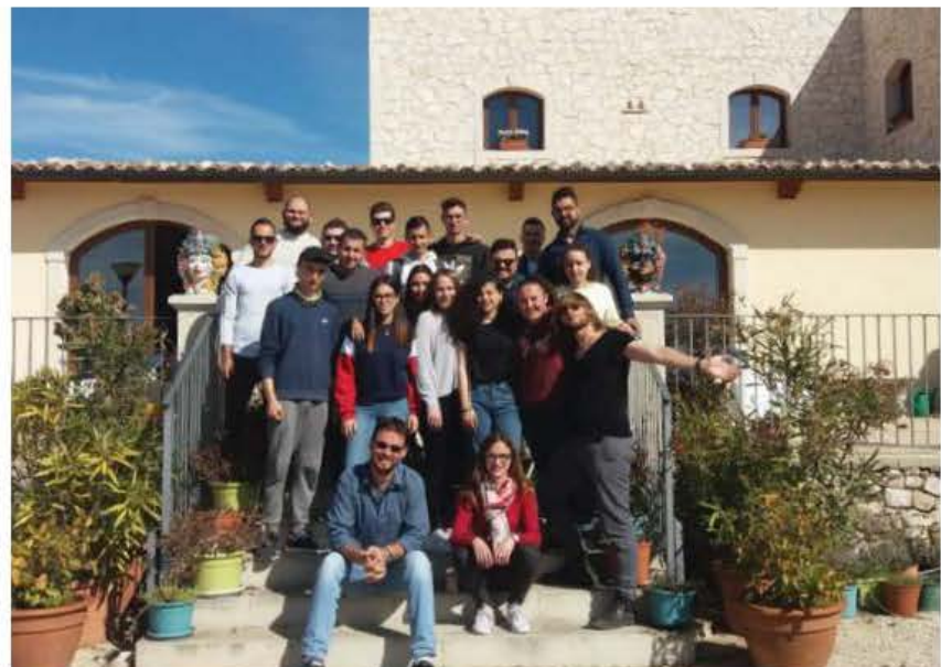
Ritratt tal-istudenti ġewwa Artemisia