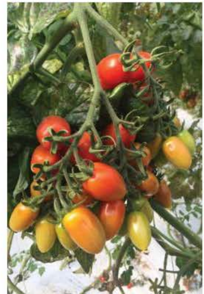
Produzzjoni ta' tadam organiku ġewwa Natura Iblea

Permezz ta' din il-mawra edukattiva l-istudenti kellhom l-oportunità jaraw u jitgħallmu dwar prattiki godda fis-setturi tal-agrikultura u l-akkwakultura waqt li jżuru entitajiet li joffruhom esperjenza haġja tad-dinja tax-xogħol fis-settur tagħhom.