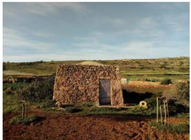
Girna li tixbah id-Dammusi