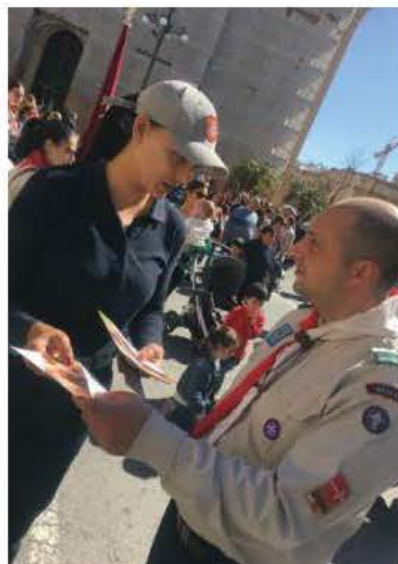
Uffiċjal jgħati informazzjoni lill-pubbliku