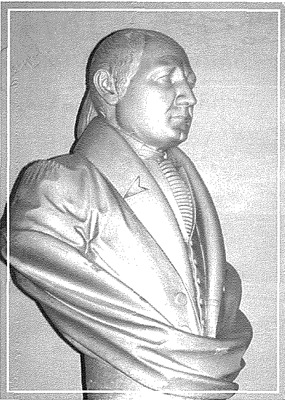
Bust ta' Vincenzo Borg fl-Awla Kapitulari