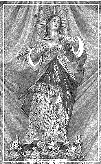
Statwa tal-Kuncizzjoni - Patrijiet Frangiskani, Victoria, Għawdex