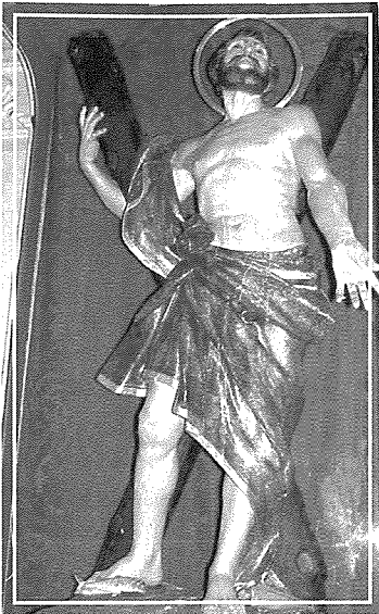
Statwa ta' S. Andrija - Bormla