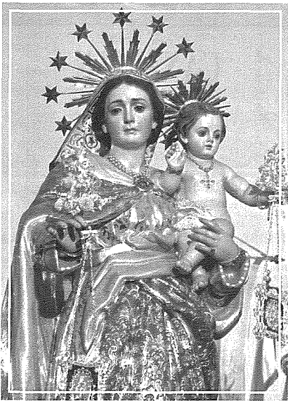
Statwa tal-Madonna tal-Karmnu - Żurrieq

xoghlijiet oħra ta' skultura minn idejn l-istess Salvu. Fl-1830 għamel statwa tar-Redentur għall-Fratellanza tal-Kurċifiss Ta' Ġiezu l-Belt, li madankollu saret oħra minflokha fl-1889. Is-sena ta' wara għamel fl-injam l-istatwi tal-Marbut u l-Eċċe Homo għall-purċissjoni tal-Ġimgha l-Kbira tal-Birgu. Fl-1832 għamel statwa tal-ġebel ta' San Publiju għall-Furjana (aktar tard fl-1853 kien għamel statwa oħra tal-istess qaddis li tinsab mal-kantuniera tad-Dwana l-antika) u fl-1833 skolpikka fl-irħam bust tal-Armirall Inġliż Thomas Fremantle, f'monument li jinsab fil-barrakka ta' fuq il-Belt Valletta. Tal-istess sena hija l-istatwa tal-injam ta' Kristu Rxoxt tal-Kollegġjata ta' San Lawrenz tal-Birgu.