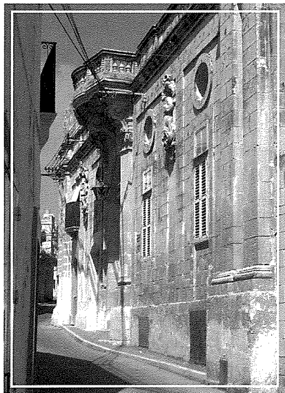
Il-Palazz ta' Santa Liena f'Has-Sajjied