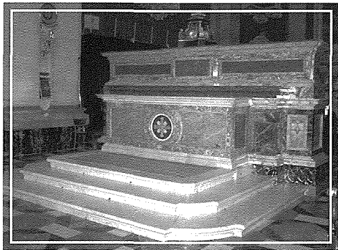
L-Altar Maġġur tal-Kollegġjata ta' Birkirkara

Dwaru jingħad ukoll li għamel madwar 170 monument f'dan it-tip ta' xogħol. Psaila kien imfittex ukoll għal xogħol dekorattiv fi djar privati. L-iskultur u marmista Salvu Psaila miet f'Birkirkara fit-12 ta' Novembru, 1871 fl-età ta' 73 sena fid-dar fejn kien joqgħod, 86 Triq il-Wied. Kien sarlu funeral xieraq u ġie midfun fil-Knisja Kollegġjata ta' Birkirkara.