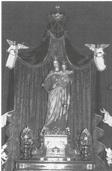
Il-vara tal-Awżiljatriċi armata għall-festa fil-kappella.

waqt li baqa' miexi bil-hidmiet karatteristiċi tiegħu u fl-1983 kienet twaqqfet mill-ġdid is-St. Paul's Brigade u bdew isiru attivitajiet godda li waqt li għaqqdu l-komunità taz-zona, kabbru l-popolarità tal-post fil-pajjiż. L-għadd ta' zghazagh li kienu jattendu kompli jikber ukoll, u mhux minn Birkirkara biss. Għalhekk kien inholoq il-grupp: Nikbru Flimkien li kien jitmexxa bil-hidma tal-istess ġenituri taz-zghazagh u ta' Youth Workers.