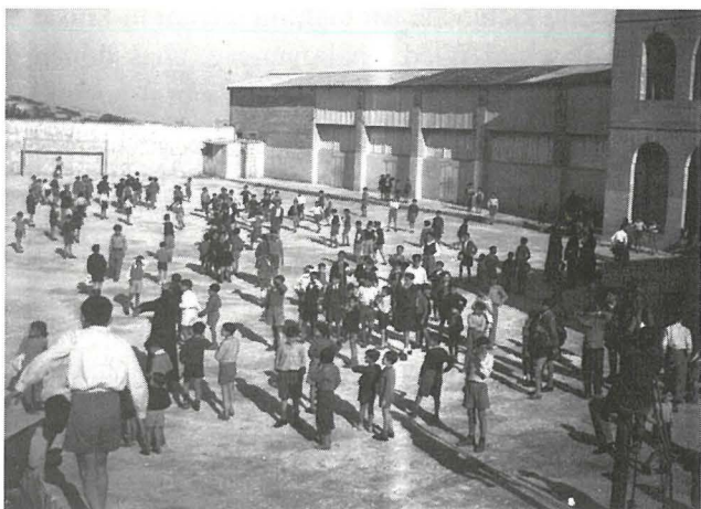
Fil-ground tal-Oratorju, kmieni fis-snin hamsin.

Iż-żmien ta' wara l-mewt tal-Monsinjur, kien diffiċli għas-Soċjetà, peress li kien għad ma kellhiex hafna membri qassisin li minbarra l-Oratorju riedu jlahhqu mal-Istitut ta' San Ġużepp u mad-Dar ta' Sant' Agata li kienet għadha fil-bidu tagħha. It-taqlib