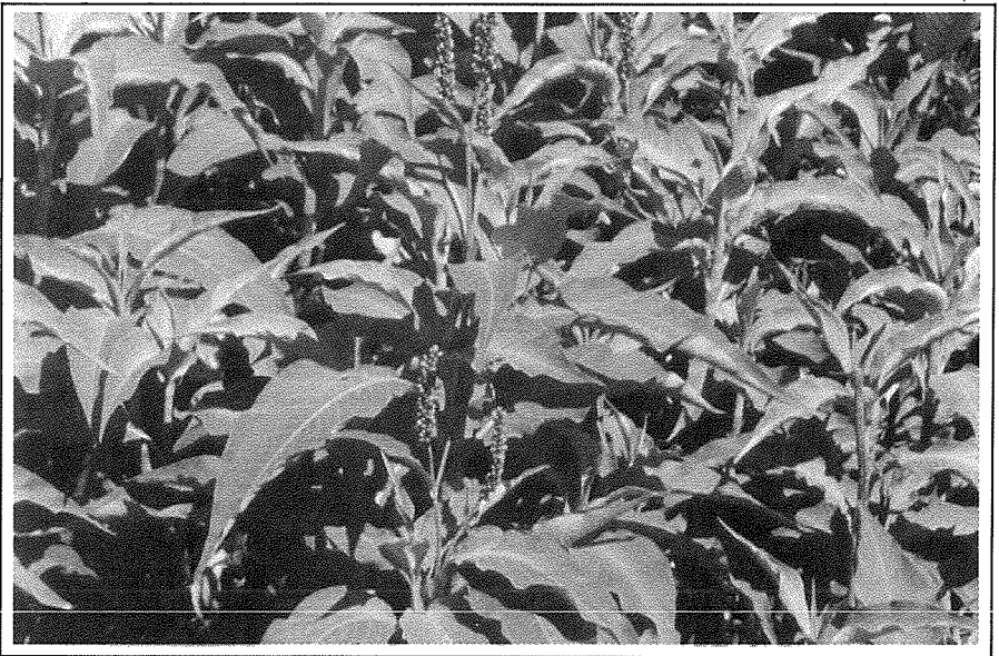
Is-Siġra tat-Tabakk