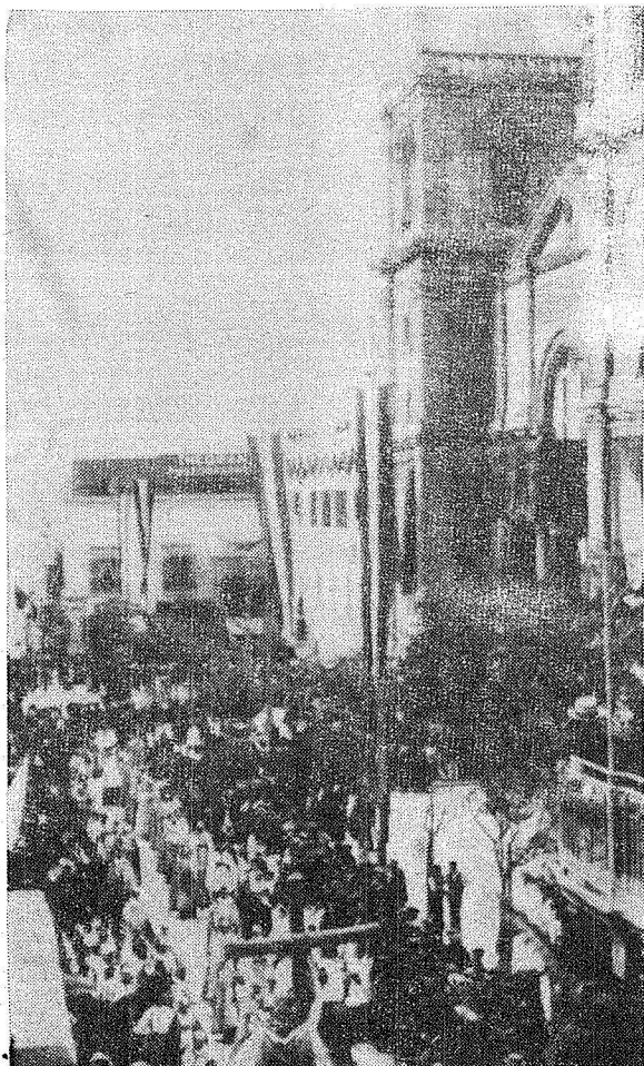
Il-faccata imzejna tal-Kon-Katidral.

Meta, fit-3 ta' Settembru 1800, il-Franċiżi tkeċċew minn Malta, u daħlu 'flok-hom l-Ingliżi l-Isqof Labini (l-kompli fil-paġna 22)