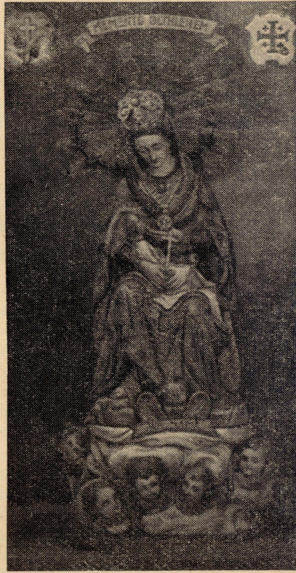
Betlehem — Distatwa tal-Madonna tal-Halib, fin-nieċa fuq l-artal.

qedem. Dan hu il-għaliex kienet im-nissla mingħajr tebgħa. L-Arkanġlu Gabrijel, miġgħut minn Alla, deher lil din it-Tifla Safja ta' Nazaret u sell-milha bhala: "Mimlija bil-ħajr!", u haħbarha li hi kellha tkun l-Omm tal-Heħlies, l-imwiegħed u mistenni.