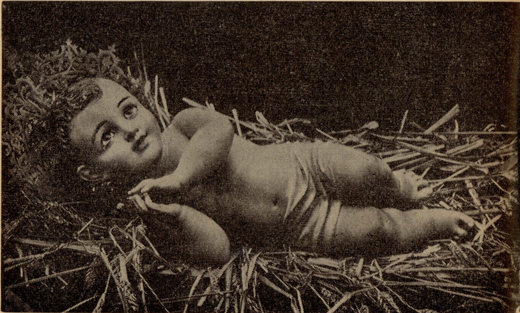
It-Twelid tal-Bambin Gesù