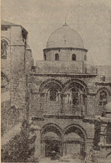
Gerusalem — il-Bażilka tal-Qabar ta' Kristu fejn isiru l-Ċerimonji tal-Gimgha l-Kbira u tal-Ghid.

Din is-sena l-Ghid il-Kbir tal-Latini (Kattolki) u tal-Ortodossi habat jum wiehed, għal hekk folol kbar ta' nies, f'dawk il-jiem, iltaqghu f'Gerusalem. Għadd kbir ta' Ewropijin u għadd