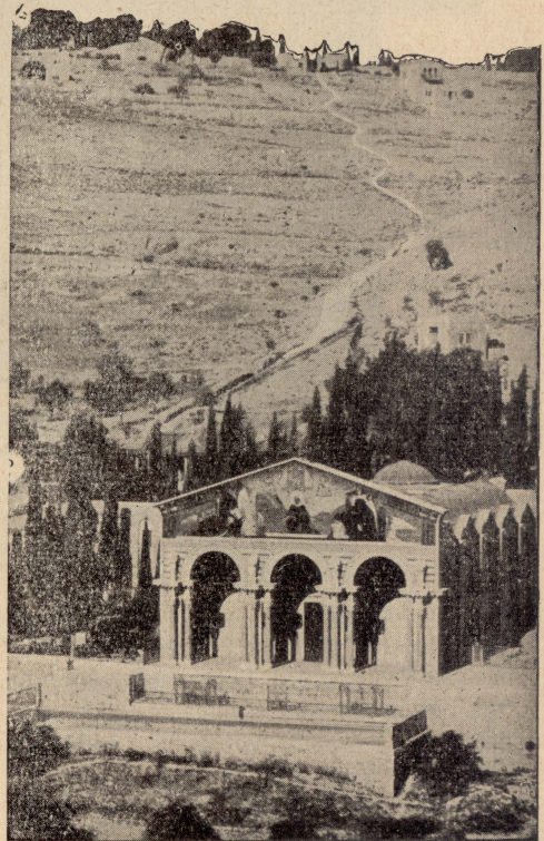
Gerusalem — Dehra tal-Bażilka tal-Ġetsemni, minn barra —

Bażilka. Għal kemm kien hemm dawk in-nies kollha, iċ-ċerimonji, tal-Latini u tal-Ortodossi, saru sewwa, li bis-sabar u l-għaqal xieraq stennew lil xulxin. Il-Pulizija Gurdanija għamlet xogħol tajjeb. Kien hemm rixtelli tal-hadid, għal dawk il-jiem, fil-misrah żgħir ta' quddiem il-Bażilka u ma 'tul it-taraġ li jiehu għaliha, biex minn irid j i d h o l , jghaddi min-naħa, u min irid johroġ, min-naħa oħra. Għieda żgħira nqalghet bejn l-Ortodossi Sirjani u Qoptin, waqt il-purċissjoni tagħhom, li waqfet malajr. L-isbah funzjonijiet Kat-