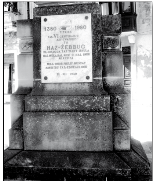
Monument li jfakkara is-600 sena parroċċa