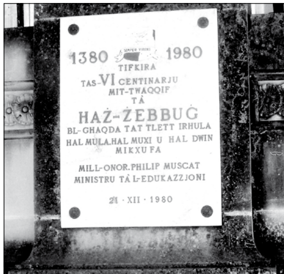
Detall tal-lapidi li hemm fuq il-monument

jikber, inħasset il-ħtieġa ta' knisja parrokkjali akbar. Fl-1599 fl-istess post bdiet tinbena l-knisja li hemm illum għamla ta' salib, minflok il-qadima, u din tlestiet fl-1632. Id-disinn kien tal-famuż Tumas Dingli. Aktar 'il quddiem tkabbar il-kor bi prospettiva stil klassiku minn Lorenzo Gafà, hu l-iskultur magħruf Melkjore Gafà.