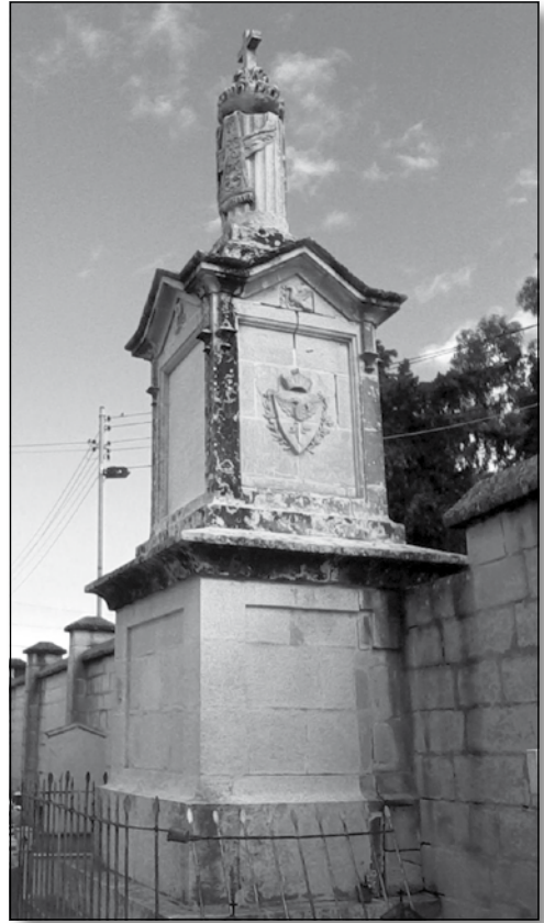
Il-Monument għal Dun Filippu Calleja fiċ-Ċimiterju tal-Qalb ta’ Ġesù Haż-Żebbuġ

sal-lum il-ġurnata u hija magħrufa bħala l-“Missjoni l-Kbira.” Dun Bert Attard jissema li kien bniedem ta’ qdusija u Dun Salv Ciappara jsejjaħlu “martri tal-ħniena.” Dwaru jgħid: “professur tal-letteratura fis-Seminarju, kien bniedem mogħni bl-għerf u l-ħniena... kiteb bosta skrizzjonijiet u panigierki sbieħ bit-Taljan... kien jorqod mal-art għera u jserraħ rasu fuq ġebli li kien iżommha moħbija taħt is-sodda. Kulma mbagħad kien ikollu kien iqassmu lill-fqar. Imqar