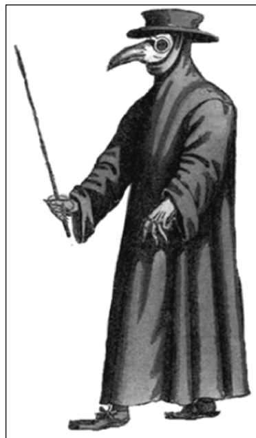
Għata li kienu jużaw it-tobba biex jiproteġu lilhom infushom