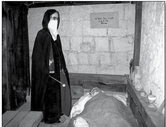
Tqarbin fi żmien il-pesta

Problema kbira oħra li l-katavri kienu joħolqu kienet proprju min ser jidfinhom, għalhekk inħarġu l-ħabsin sabiex jieħdu ħsieb it-trasport u d-difna tagħhom. Esposti daqstant għall-mard, ħafna minnhom spicċaw mietu, u għalhekk ingiebu minflokhom prigunieri oħra, diversi minnhom bil-kundanna tal-mewt, minn Sqallija. Bħala kumpens, dejjem jekk jgħixu, dawn il-prigunieri ma' tmiem l-imxija ġew imwegħda l-ħelsien, bil-kundizzjoni li jhallu pajjiżhom. Filwaqt li t-tobba, wara li jindilku bil-hall, kienu jilbsu libsa partikolari - għata li kienet tinkludi maskra f'għamla ta' munqar twil – il-bekkamorti kienu jxjeddu fuqhom innatar twal tal-kotnina midluka biż-żejt b'barnuż f'rashom. Id-dehra tagħhom fit-toroq kienet tqanqal biża' kbir, mhux biss għall-fatt li kienu jgħorru l-iġsma tal-vittmi iżda wkoll għad-dizonestà li kienu magħrufa li jwettqu minn kull fejn jgħaddu. Jissemew diversi grajjiet li jitfgħu dawl dwar dak li għaddew minnu tant imsejtna li, wara li kienu diġà ntaqtu mill-pesta, sfaw għal darb'oħra vittmi, din id-darba ta'