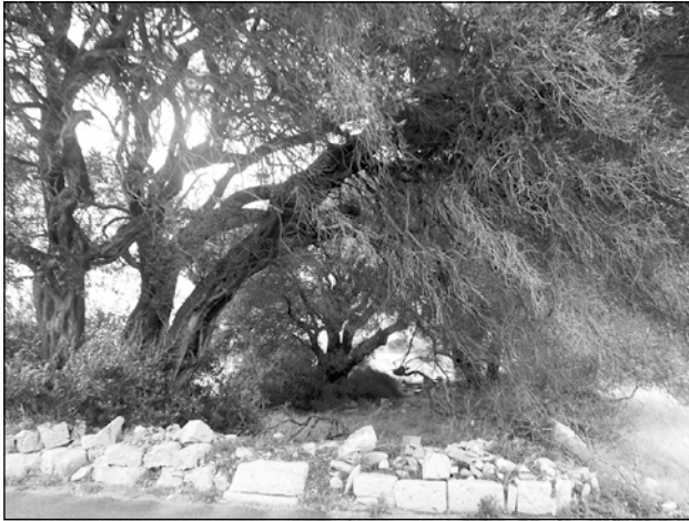
Iċ-Ċimiterju Ta' Trapna Haż-Żebbuġ

ta' Haż-Żabbar fejn illum hemm iċ-ċimiterju tal-Ħniena; f'Haż-Żebbuġ f'żewġ ċimiterji fl-inħawi magħrufa "tal-Għodor" li flokhom illum hemm iċ-ċimiterju ta' Sant'Andrija; taż-Żejtun fiċ-ċimiterju ta' Santu Rokku biswit il-knisja ta' Santa Katarina l-Qadima, magħrufa aħjar bħala dik "ta' San Girgor", li suċċessivament dam magħluq mitt sena; taż-Żurrieq fl-inħawi tal-kappella ta' Hal Millieri; u dawk tax-Xagħra, Għawdex, f'għalqa fl-inħawi ta' Għajn Lukin, midfen li llum jinsab fi stat t'abbandun kbir. Naturalment, kien hemm xi eċċezzjonijiet, meta xi wħud sfaw midfuna f'xi għalqa għalihom weħidhom u oħrajn f'xi kripta ta' xi knisja u l-oqbra tagħhom ġew imbarrati bil-ħadid sabiex ma jinfethux qabel ma jgħaddu tal-inqas mitt sena mid-difna.