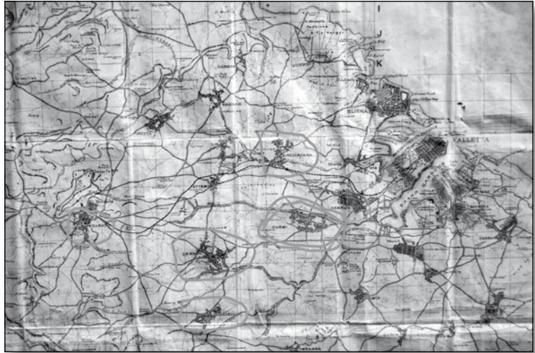
Mappa li turi l-irhula l-aktar milquta mill-pesta 1813-14