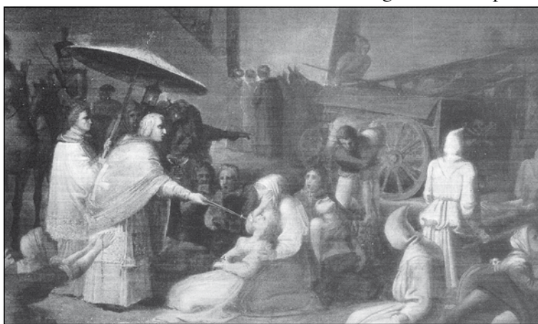
Tqarbin fi żmien il-Pesta, pittura ta' Pietru Pawl Caruana