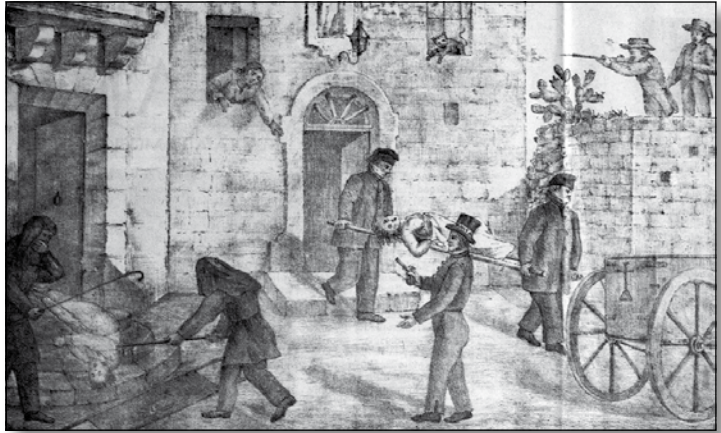
Xeni ta' x'kien isehh fi żmien il-pesta tal-1813-1814