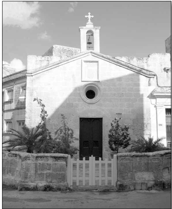
Il-Kappella ta' Santu Rokku Haż-Żebbuġ

Taqbila popolari dak iż-żmien kienet tgħid: "tal-Belt l-irvinati; tal-Birgu l-impestatu; ta' Bormla l-attakkati u tal-Isla l-irvellati." Issa peress li l-Isla matul l-imxija tal-pesta tal-1813 baqgħet bla mittiefsa, il-Kanonku Fortunato Panzavecchia (1797-1850), skular magħruf Senglean, biddel din it-taqbila għal "tal-Belt l-irvinati; tal-Birgu l-impestatu; ta' Bormla l-attakkati u tal-Isla Illiberati" 19 . Ma' tmien l-imxija saru diversi avvenimenti ta' radd il-ħajr lil Alla talli l-poplu fl-aħħar nett inheles minn dan il-flagell qerriedi. Fil-kon-katedral ta' San Gwann tkanta t-Te Deum fid-29 ta' Jannar 1814, jum li nżamm bħala wiehed solenni; f'Hal Qormi twaqqfet statwa ta' San Bastjan, qaddis meqjus bħala protettur