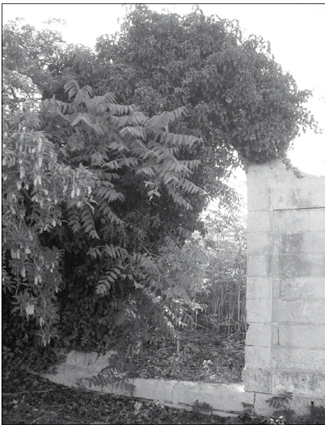
Iċ-Ċimiterju Ta' Brija Siġġiewi

Dari l-mejtin kienu jindifnu fil-knejjes rispettivi tal-irħula u l-ibliet tagħhom, bl-eċċezzjoni ta' dawk li jmutu b'mard infettiv, b'mod speċjali bil-pesta u l-kolera. Jekk dan il-mard qerriedi kien johloq problema fl-assistenza lejn dawk milquta, il-katavri ta' dawn tal-aħħar kienu joholqu problema akbar, haġa li kienet tirrepeti ruħha ma' kull imxija. Knejjes abbandunati u għelieqi 'l barra mill-abitat laqgħu fihom għexerien ta' katavri ta' dawn l-imsejtna. Fl-1813, il-vittmi ta' Birkirkara ngħidu aħna, indifnu fil-Knisja l-Qadima (dik il-ħabta abbandunata), u fil-madwar tagħha, kif ukoll f'ċimiterju li twaqqaf apposta fl-inħawi li sal-lum għadhom jissejħu "tal-Infetti;" ta' Hal-Lija f'dak li illum inbidel fiċ-ċimiterju tar-raħal li naraw fit-triq li tiegħu għall-Mosta; ta' Hal Luqa fil-kappella ta' Santa Marija tal-Ftajjar u fiċ-ċimiterju fit-triq tal-Gudja, li minnu maż-żmien ħareġ iċ-ċimiterju li naraw illum; tal-Mosta f'dak magħruf bhala "ċ-Ċimiterju l-Qadim" fl-