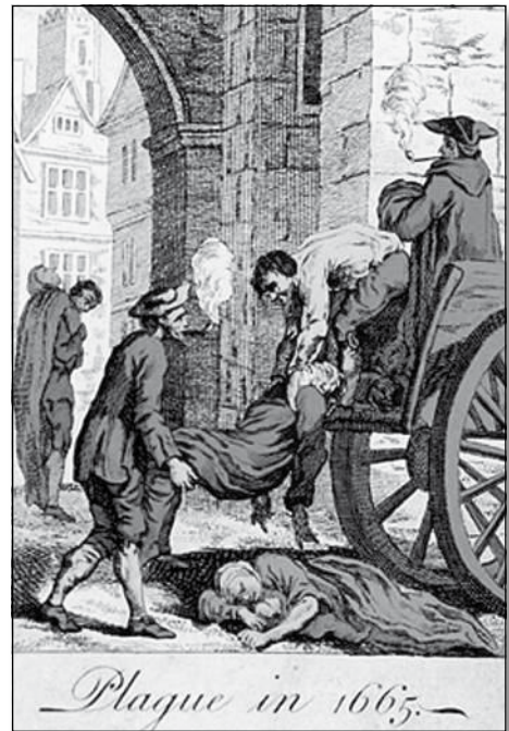
Pittura xena mill-pesta