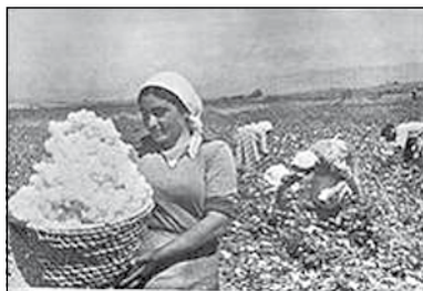
Gbir tal-qoton fl-Armenia (1930)

l-esportazzjoni tal-qoton minn dan il-kontinent waqfet u l-Ingilterra u Franza bdew jixtru mill-Egittu fejn saru investimenti kbar fil-kultivazzjoni tal-qoton. Meta fl-1865 il-gwerra ċivili fl-Amerika ntemmet is-suq Egizzjan ġie abbandunat għax il-qoton Amerikan kien irħas u aħjar. Dan kellu effett tant qawwi li l-Egittu falla fl-1876, fattur ewlieni li wassal għall-ħakma tal-Egittu mill-Ingilterra fl-1882. Fl-istess waqt il-bejgħ tal-qoton għen mhux ftit l-iżvilupp tal-Amerika. Daqshekk kienet importanti l-industrija tal-qoton.