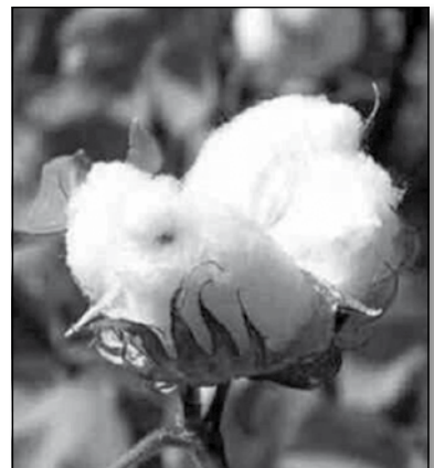
Tajjar tal-qoton lest biex jingabar

Il-biedja baqgħet tagħti l-kontribut siewi tagħha l-ekonomija Maltija. Il-bidwi Malti baqa' jkabbar il-qoton u gawda ħafna bejn l-1861 u l-1865 għax minħabba