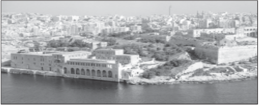
Fig. 4. Dehra moderna ta' l-isptar tal- Lazzarett (isfel, xellug) qrib il-forti Manoel fil-port ta' Marsamxett

f' Castel Nuovo hdejn Napoli 32 , biss, irnexxilu jahrab u rritorna Malta. Minn hemm baqa' sejjer u nghaqad mal-kumpanija tar- Regiment of Malta nhar is-Sibt, 11 t'Awissu 1810. Billi dan kien it-tir li dejjem kellu f' mohhu, ghalhekk, kemm dam il-habs m'acçettax li jinghata l-liberta' provizorja.