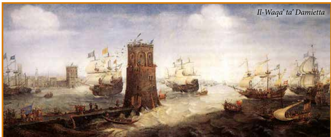
Il-Waq' ta' Damietta

L-għada filgħodu al-Kamel irtira għax ma kienx hemm possibiltà li jsalva l-belt. Imma l-Kruċjati, immexxijin minn Balian ta' Sidon, ma sabu l-ebda rezistenza meta daħlu Damietta. Il-kronista u kjeriku Oliver ta' Paderborn li kien preżenti waqt il-Ħames Kruċjata (1217-1221), awtur tal- Historia Damiatina , jikteb li, minn 80 elf abitant 3 elef biss kienu għadhom ħajjin meta l-Kruċjati rebħu l-belt fil-5 ta' Novembru 1219, u li minn dawn 100 biss ma kinux morda. Bejn is-swar u l-ħitan tal-belt, fil-foss, il-Kruċjati sabu eluf ta' iġsma ta' mejtin bil-pesta fi stat ta' dekompożizzjoni. Id-dehra kienet waħda tal-biża'. Jekk San Franġisk daħal magħhom fil-belt, dak il-jum kellu jibqa' immarkat fil-memorja sensibbli tiegħu bħala prova tal-assurdità tal-gwerra, l-aktar jekk hi gwerra f'isem kawża qaddisa.