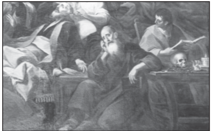
Il-figura ta' Padre Pelagio, xogħol ta' Francesco Zahra (1758)

Kien kittieb prolificu u predikatur tajjeb. Padre Pelagio jibqa' wkoll maghruf għal