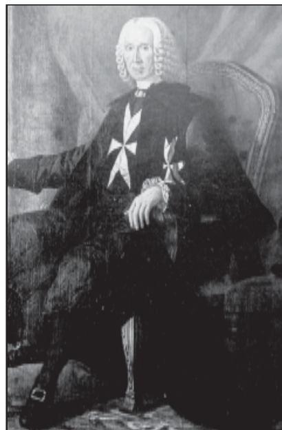
Fig. 5. Il-Granmastru Ximenes

L-irvell tal-qassisin ma wassalx għall-ghan li għalih kien tfassal biss wera li l-polz tal-Maltin kien diġà beda jħabbat bil-qawwi, kif kellu jidher ċar waqt l-irvell kontra l-Franċiżi (1798-1800).