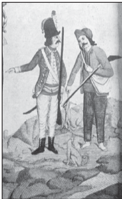
Fig. 2. Inċiżjoni tas-seklu 18 li turi kapural ta' l-ordni jammoni kaċċatur talli qabad fenek kontra l-liġi.

Kavallier tal-belt Valletta halli jbdew rewwixta kontra l-Ordni bit-tama li jikkonvinċu 'l-Ximenes li jraħhas il-qamh 6 . Dan għax kif irraġunaw huma, wara jum ta' ċelebrazzjonijiet ta' tifikira tar-rebħa ta' l-Assedju l-Kbir, is-suldati ta' l-Ordni kienu jkunu għadhom għajjenin u ma joffruhomx reżistenza qawwiya.