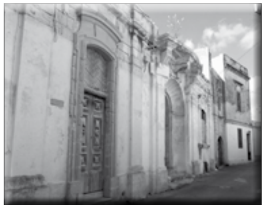
Coronation Candles fi Triq Vassalli

Coronation Candles kienu jiproduċu wkoll xemgħat żgħar magħrufin bħala x-Xemgħat tat-Tazza, u oħrajn kemmxejn itwal, magħrufin bħala tas-Sitta jew tat-Tmienja, skont kemm ikun hemm xemgħat fil-pakkett. Hawn ma nistgħux ma nsemmux il-famuża xemgħa ħamra, li għadha ferm popolari mal-Maltin sal-gurnata tal-lum. Din