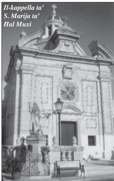
Il-kappella ta' S. Marija ta' Hal Muxi

ta' faqar, ma kienx possibbli li huma jsibu min jagħtihom elemożna tal-quddies għal kuljum. Għal x'uhud, kienet l-uniku dhul tagħhom. Fil-knejjes, kien iqaddes min imissu. Kien hemm ukoll dawk li ma kinux iqaddsu, imma xi hadd kien jagħtihom l-elemożna biex iqaddsu l-quddies għal xi hadd. Dawn kienu jfittxu lil xi hadd li ried iqaddes u ma kellux l-elemożna. Huma jiftieħmu miegħu biex jagħtuh nofs l-elemożna u n-nofs l-iehor iżommuh huma. L-isqof hadha bl-ahrax kontra dawn. Lilhom heddidhom bis-sospensjoni. Akkużahom b'simonija għax dak ma jixraqx għal saċerdot. Kienet bħall-kummerċ minn haġa sagra. 15