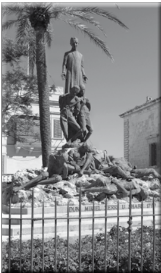
Il-Monument f’għieħ Dun Mikiel u shabu fil-Belt Valletta