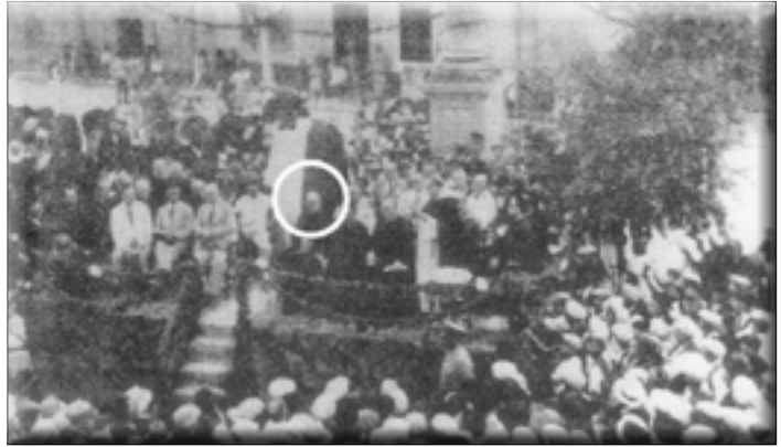
Ritratt li juri t-tifkira tal-mitejn sena mit-twelid ta' Dun Mikiel Xerri f'Haż-Zebbuġ. F'dan ir-ritratt tas-26 ta' Settembru tal-1937 fil-pjazza jidher ukoll Dun Karm li kien ippresieda din il-kommemorazzjoni.

Fil-ġlied kontra l-ingann u l-ħażen, Dun Karm iħegġeg u jfakkar, anzi kwazi jwissi liż-Zebbuġin tal-lum u ta' għada biex ikunu "rġiel"