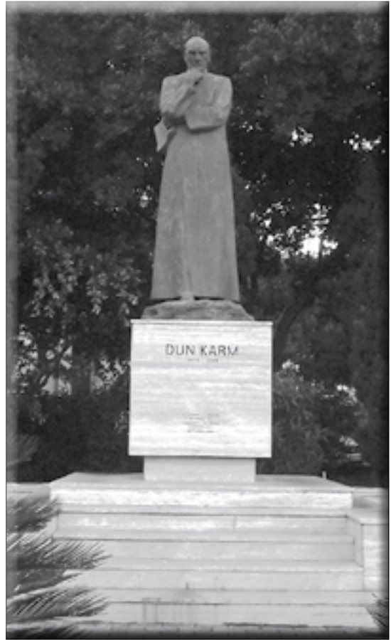
Il-mafkar lil Dun Karm qrib il-Belt kapitali ta’ Malta.

Din hija poeżija tradizzjonali fl-istil tipiku mfittex minn Dun Karm. Nistgħu għalhekk nġhidu li t-tematika jġigifieri t-tifhir lejn it-tradizzjoni u l-qlubija komunitarja taż-Żebbuġin u l-qlubija individwali ta’ Dun Mikiel huma riflessi wkoll fi stil tradizzjonali. Dun Karm iħaddem il-vers tat-tmienja (l-ottonarju), vers melodjuż u ferrieħi li joqgħod ħafna għall-għana (tradizzjoni oħra li tiġbor linnes f’komunità) u jinqeda bil-kwartini u bir-rima mqabbża (it-tieni vers jirrima mar-raba’ vers), rima ħafifa u mexxejja.