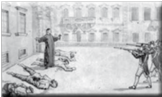
Il-fuċilazzjoni tal-Eroj Dun Mikiel Xerri.