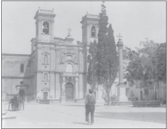
Il-knisja Arċipretali ta' Haż-Żebbuġ qabel ma nbnew in-navi fil-bidu tas-Seklu XX. Il-mixi u l-ġarr bil-karrettun kienu komuni hafna. Jidhru l-ewwel turgien tal-Knisja San Filep.