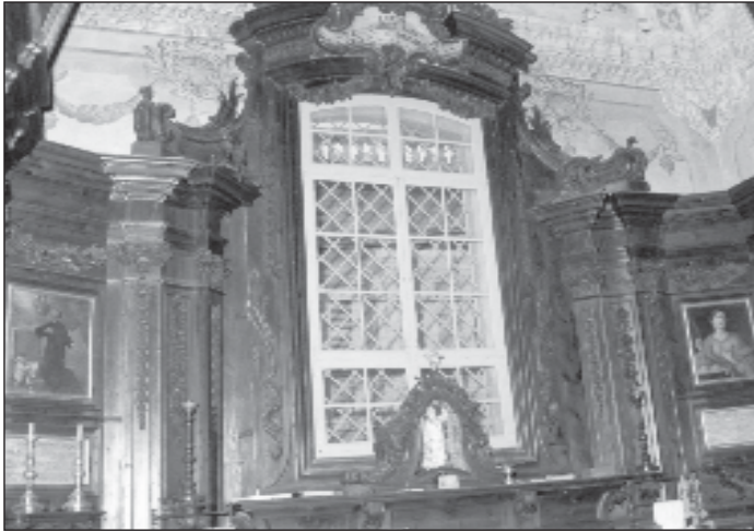
Xogħol tassew imponenti fl-injam li jinsab fis-sagristija tax-xellug tal-Knisja Parrokkjali ta' Haż-Żebbuġ.

ghal dik tar-Rużarju, l-kumplament ghadu ntatt ipaxxina, kif ghamel lil antenati taghna. Hawn ta' min jaghmel parentesi ckejkna biex isemmi wkoll l-artali sbieh li jsebbhu dawn il-kappelluni. L-ghazla tal-irham hija fattur mill-aktar importanti u wara t-tizjin bl-injam jew bronz. F'nofshom imbaghad l-artal maggur, opra mill-ahjar (ghalkemm fis-seklu dsatax giet mnezza mil-faccata tal-mensa kontra kull regola ta' l-arti), li nhadmet f'Ruma fuq disinn ta' Zahra. Il-Gilandra u t-tabernaklu fihom ornamentu tal-bronz indurat il-gmiel tagghom. Jinghad li din it-tribuna kellha titneha minn fuq l-artal u ghaliha sar bhala bazi il-hawt tal-irham li hemm hdejn il-bieb maggur biex jintuza bhala battisterju. Dan bit-tama li tkun tista' ssir il-gilandra tal-fidda halli jitkompla t-taghmir rikk tal-maggur. Però, kienu diversi li ma' xtaqux inehhu il-gilandra mill-post originali taghha, ghalkemm dan ic-çaqliq kien studjat minn qabel. Wiehed li kien ferm kontra li dan isir kien l-Arcisqof Gonzi li sa