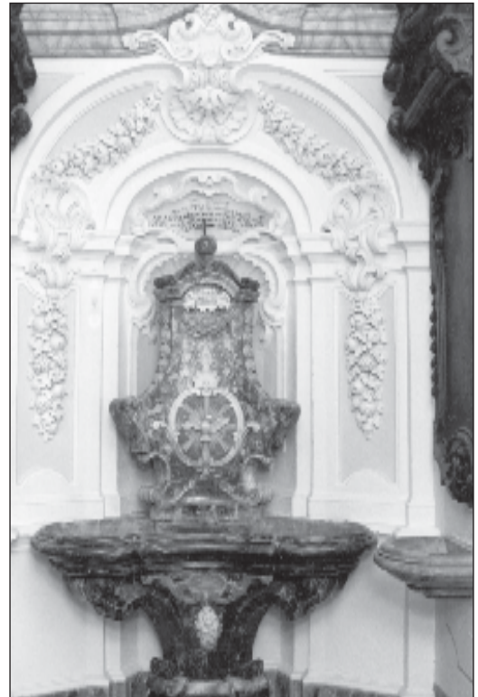
Il-ħawt jew fontana ta' l-irħam, fis-sagristija tal-Knisja Parrokkjali ta' Haż-Żebbuġ.