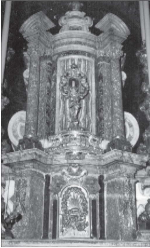
Xogħol sabiħ ta' l-irħam, li hu parti mill-artal magħgur tal-Knisja Parrokkjali ta' Haż-Żebbuġ.

zewġ opri mill-isbah li jitgawdew fil-festi prinċipali. Dawn huma l-lampier il-kbir u s-Salib tal-Kleru. It-tnejn fihom xogħol impekkabbli ta' disinn Barokk li Brondes kien tant kappaci għalih; tant li donnu jmur fir- Roccoco . Biċċa xogħol sabiħa ta' dan il-perjodu huwa bla dubju ir-relikwarju tal-padrin tal-parroċċa, San Filep t'Aggira. Kien iżżanzan fl-1724 u hu ghotja tal-Gran Mastru De Vilhena. Dan serva ċertament biex ikun ta' livell għoli kif juri x-xogħol innifsu. L-anġlu li jservi bħala sieq ifakkrek f'bosta relikwarkji simili Sqallin u wisq probabbli sar fuq disinn ta' Pietru Pawl Troisi li kien jahdem mal-Ordni u li kien responsabbli għad-disinn tal-kustodja fejn titpoġġa din ir-relikwija matul is-sena. Is-Salib bi tminn ponot fil-parti ta' fuq,