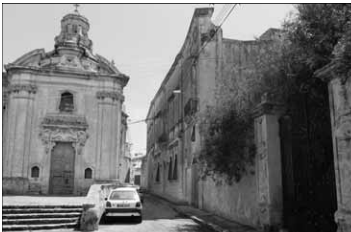
Il-Kappella tal-Abbandunati u Villa Buleben tal-Familja Azzopardi fi Triq il-Madonna, Haż-Żebbuġ.

tad-devozzjoni Marjana lejn tal-Abbandunati fil-gżejjer Maltin sehhet bis-saħħa ta' intervent li kien għamel Fra Ramon Perellos y Roccaful meta kien għadu Balliju u qabel ma nhatar Granmastru tal-Ordni ta' San Ġwann u l-Kap ta' pajjiżna fl-1697? Kont taf li kien sewwa sew fis-sena 1758 li nbriet il-knisja filjali tal-Madonna tal-Abbandunati f'Haż-Żebbuġ fl-inhawi magħrufin bhala Hal Dwin u li l-fundatur tagħha kien is-sacerdot Dr