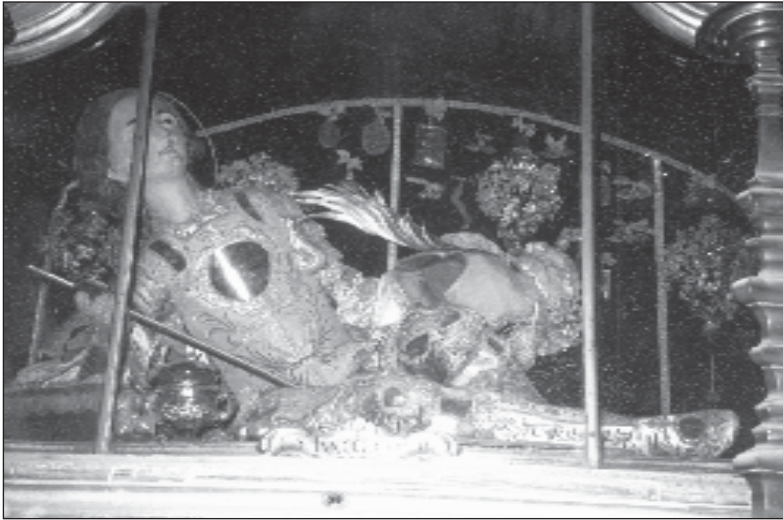
Il-Corposanto ta' Sant'Innoċenz li jinsab fuq l-altar tal-kappella tal-Madonna ta' l-Abbandunati f'Haż-Żebbuġ.

b'xogħol sabih ta' lavur. Hemm ukoll struttura ta' l-injam wiesgħa xi tliet metri, fonda metru u għolja żewġ metri, li hi speċi ta' gradenza u fuqha bħal armadju, li flimkien jiehdu l-forma ta' altar ta' qabel il-Konċilju Vatikan II. Għad hemm ukoll il-pulptu żghir.