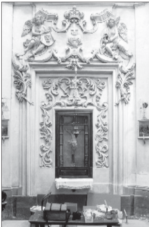
Niċċa tal-Kurċifiss fil-kappella tal-Madonna ta' l- Abbandunati f'Haż-Żebbuġ.

ta' Ottubru fil-knisja kien jinghad ir-rużarju kull filghaxija u tinghata l-barka sacramentali.