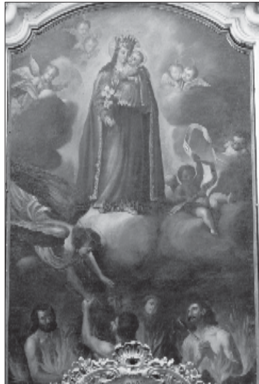
Il-pittura fuq l-artal tal-Kappella tal-Madonna ta' l-Abbandunati f'Haż-Żebbuġ.

Anke fis-sagrastija hemm xi jpaaxxi l-ghajn. Is-saqaf li fih forma ta' troll, huwa mpitter. Insibu hawt tal-ġebel imdawwar