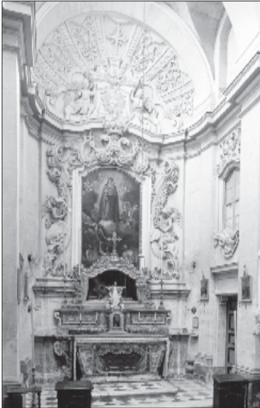
L-artal tal-kappella tal-Madonna ta' l-Abbandunati f'Haż-Żebbuġ.