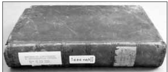
Reġistru ta' hatriet fl-uffiċju ekklesjastiku li jinsab fl-Arkivju Nazzjonali ta' Malta.