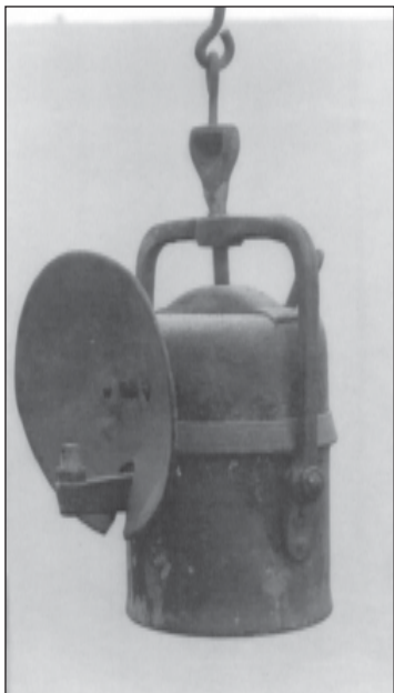
Fanal ta' l-aċiteleni għal mas-siġar

Fil-karrozzi u għall-vari tal-Ġimgha l-Kbira ma kienx hemm bżonn ta' tankijiet jew kompartimenti ta' l-ilma u tal- carbide għal kull fanal imma kienu jagħmlu sett wiehed biss li minnu johorġu pajpijiet irraq li jwasslu l-gass għal kull lampa; imma kull lampa kien