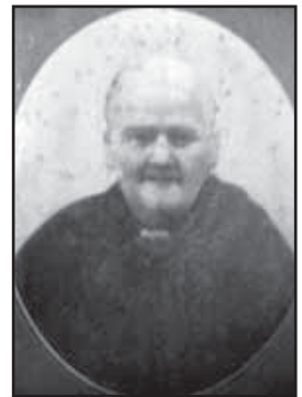
Omm Dun Karm Psaila

għax id-dagħdiġha tkattar il-hemm li nkunu fih; is-sliem jiġi mis-sabar, u l-hemm itir mar-riħ.