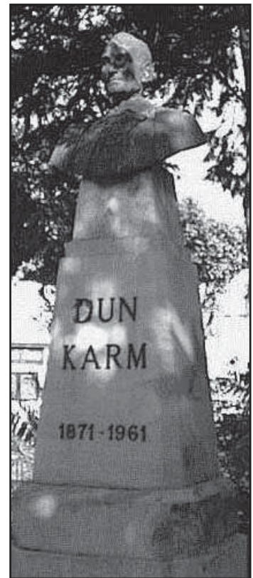
Il-bust ta' Dun Karm fiç-ċentru ta' Haż-Żebbuġ