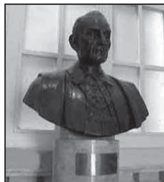
Bust ta' Dun Karm fil-Bibjoteka Nazzjonali

Meta wiehed iqabbel l-innu lil Xerri u s-sunett lil Vassalli, ma jistax ma jintebahx b'dawn il-hwejjeġ: fil-każ tal-ewwel ifahharlu qlubitu li wasslitu biex ihars bla biza' f'wiċċ il-