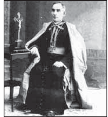
Dun Karm sar Monsinjur