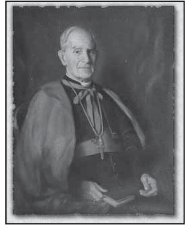
Pittura ta' Dun Karm fil-Parroċċa ta' Haż-Żebbuġ

Il-kotba msemmijin fit-test tat-tahdita huma l-ghajn ewlenija għat-tema; izda magħhom qed jitnizzlu wkoll kotba oħrajn li b'mod jew iehor ikattru t-tagħrif mimsus fuq fuq. Minkejja l-ghadd kbir ta' kitbiet li deħru dwar Dun Karm kemm f'hajtu kemm wara mewtu, l-aqwa studji li saru fuqu huma dawk tal-Professor Oliver Friggieri, li għad li hu nnifsu jista' jitqies bhala wiehed mill-kittieba ewlenin tas-Snin Sittin tas-seklu l-iehor li fihom fegget polemika ideoloġika qalila fiċ-ċrieki letterarji u fil-ġurnali ta' dak iz-żmien u sehh qtugh mill-qiegh minn mal-iskola Dunkarmjana, raddlu l-akbar ġieħ billi dahhlu fil-kuntest storiku reali tieghu; lil hinn minn dil-hidma lieżma, Friggieri ġabar il-poeziji kollha ta' Dun Karm u haffef mhux bi fit ix-xogħol tat-tiftix