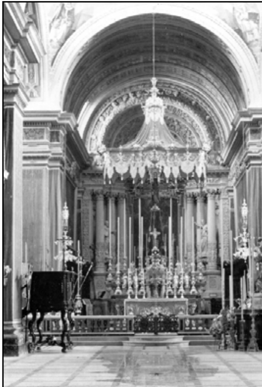
Il-knisja parrokkjali c. 1955. Innota l-pulptu minn fejn kien isir il-panigierku.

Żewġ affarijiet li jissemmew dejjem fil-kontinjet huma l-panigierku u l-mużika. Il-panigierku kien iċ-ċirasa fuq il-kejk matul il-quddiesja l-kbira solenni. Kienu jaraw li jintagħzel predikatur għaref u magħruf, li mhux l-ewwel darba li kien mir-rahall. Il-hlas għal dan is-servizz jidher li kien ta' hames skudi, filwaqt li meta kien jinġieb minn barra r-rahall kienu jhallsu wkoll għal kaless. Ġieli kien hemm min joffri s-servizz bla hlas, speċjalment meta kien ikun mir-rahall stess. Uħud minnhom, kienu jagħmlu aktar minn darba. Il-lista tal-predikaturi hija interessanti għax turi nies li