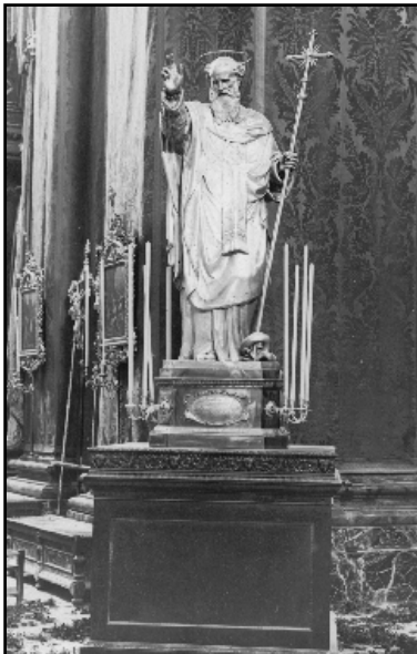
Il-vara ta' San Filep ta' Agira fl-1921. L-aqwa opra ta' l-arti f'għieħ il-qaddis patrun.

It-tradizzjonijiet popolari reliġjużi f'Haż-Żebbuġ isibu art mill-aktar fertili, sew ghalix iż-Żebbuġin, bhall-kumplament tal-Maltin, ghandhom karattru Mediterranju li jiżvoga fi hwejjeġ bhal dawn, kif ukoll ghax rawmu maż-żmien minhabba partikolari lejn dak kollu li hu ghażiż ghalihom. Il-festi liturġii u dawk ghall-qaddisin kienu u ghadhom fost l-aktar manifestazzjonijiet publiċi li n-nies taghmel ghalihom. Però żgur li fosthom kollha, n-nies ta' dan ir-rahall antik ihabirku biex jiċċelebraw l-aktar il-festa ta' San Filippu ta' Agira, titular tal-parroċċa. F'dan ix-xoghol sejrin naraw kif kienu jsiru l-elementi l-aktar importanti fil-festa, kemm interna kif ukoll esterna. It-taghrif kollu hu miġbur mill-kotba ta' l-amministrazzjoni tal-knisja parrokkjali, miktuba mill-prokuratur