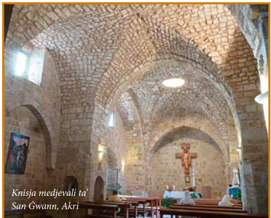
Knisja medjevali ta' San Ġwann, Akri

Al-Malek al-Kamel kien magħruf bħala Sultan qawwi imma pjuttost twajjeb. Fir-relazzjonijiet tiegħu mal-Kruċjati hu ta' spiss kien joffrilhom konċessjonijiet, li huma dejjem ċaħdu, speċjalment minħabba l-karattru instransigenti tal-Legat Papali, il-Kardinal Pelagius Galvan. L-iskop tagħna f'dawn l-artikli se jkun li nitkellmu dwar ir-relazzjonijiet bejn al-Kamel u San Frangisk t'Assisi, partikolarment rigward il-laqgħa famuża bejniethom li saret f'Damietta eżattament 800 sena ilu, f'Settembru 2019. Għalkemm bosta studjużi jqisu din il-laqgħa bħala grajja irrilevanti u marginali fl-episodji tal-Ħames Kruċjata, imma xorta waħda din il-laqgħa tikkostitwixxi punt importanti fir-relazzjonijiet bejn il-Kristjani u l-Misilmin fi żmien meta dawn kienu dejjem fi gwerra kontra xulxin.