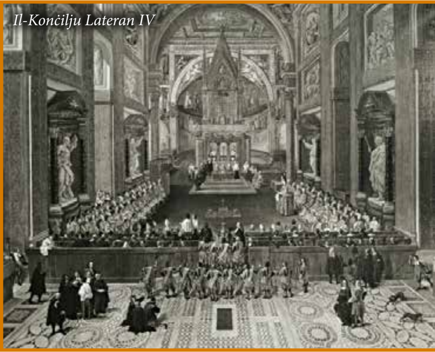
Il-Konċilju Lateran IV