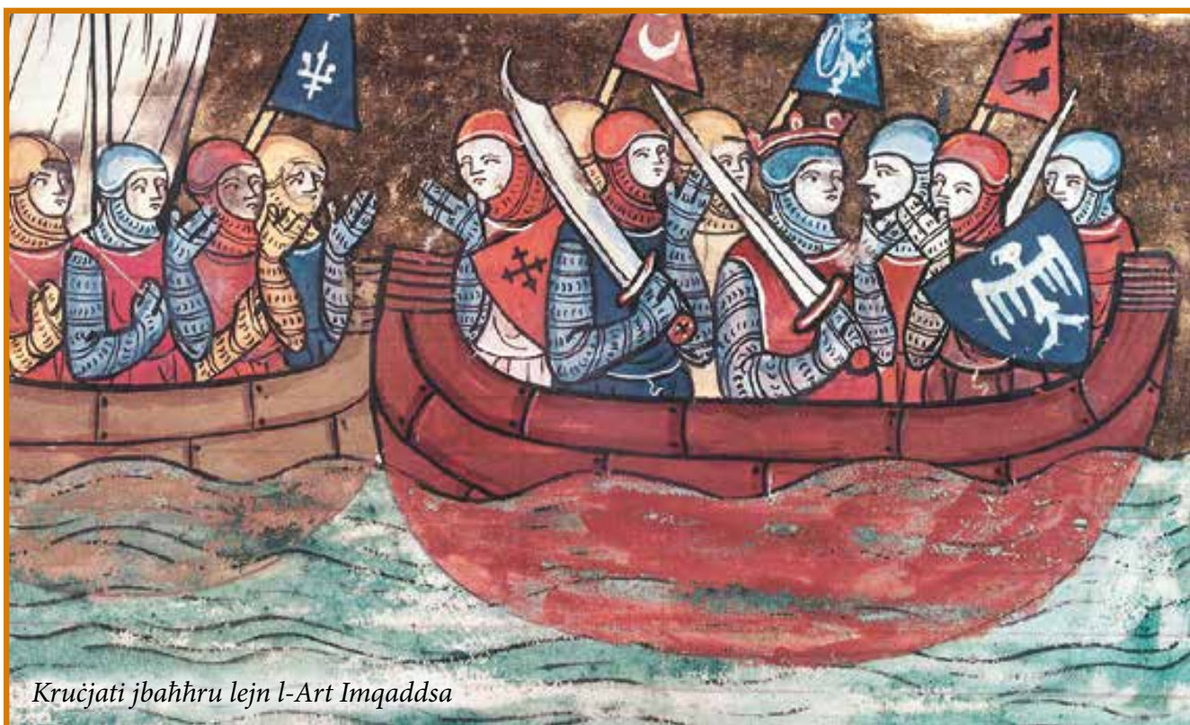
Kruċjati jbaħħru lejn l-Art Imqaddsa

Fid-9 ta’ Mejju 1218, sena wara l-kapitlu ta’ Pentekoste li fih Fra Elia ntbagħat fl-Orjent, ir-Re Jean de Brienne, id-Duka Leopold tal-Awstrija u Wilhelm tal-Olanda telqu bl-armati Kruċjati tagħhom minn Akri u niżlu qrib Damietta, fuq