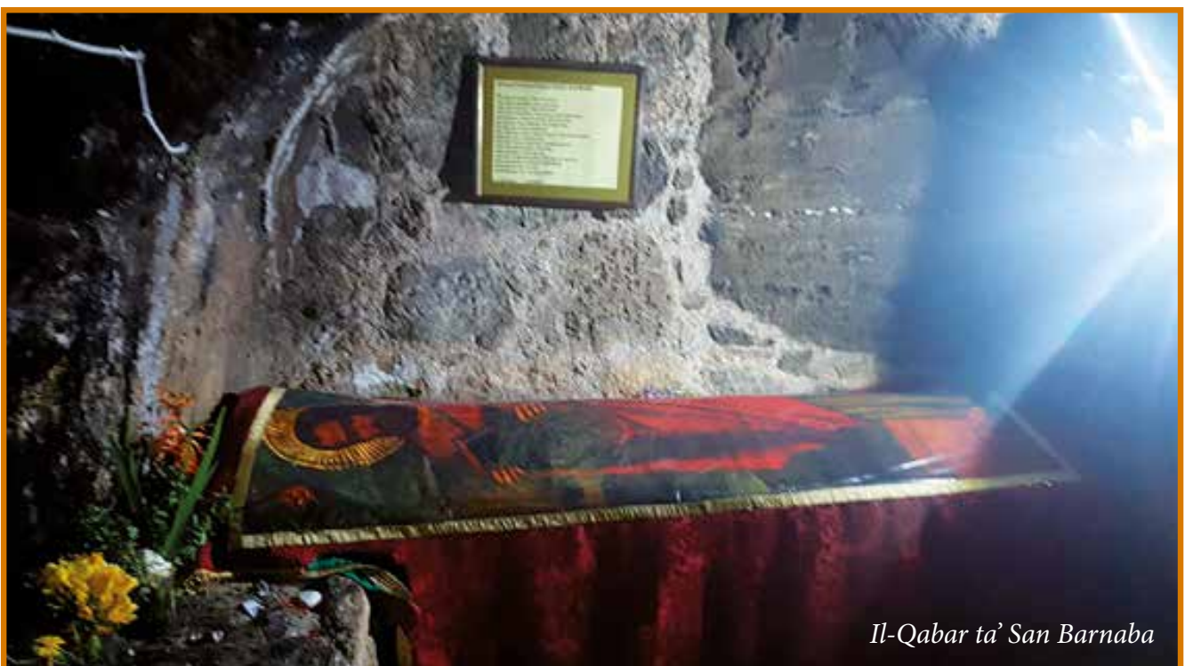
Il-Qabar ta' San Barnaba

Barnaba u Sawl, meta kienu Salamina, ippridkaw il-Vangelu fis-sinagogi tal-Lhud. Nafu li dan kien il-metodu li Pawlu kien