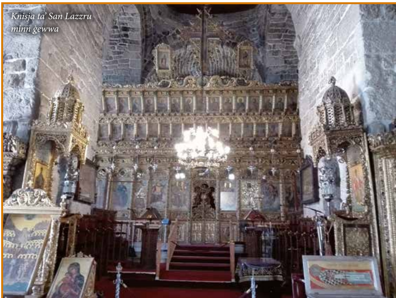
Knisja ta' San Lazzru minn ġewwa

L-aktar opra ta' arti prezzjuża tal-Knisja ta' San Lazzru hi l-ikonostasi, li hi meqjusa bħala wiehed mill-aktar eżempji fini ta' skultura fl-injam f'Ċipru. Din l-ikonostasi, flimkien ma' dik tal-knisja ta'