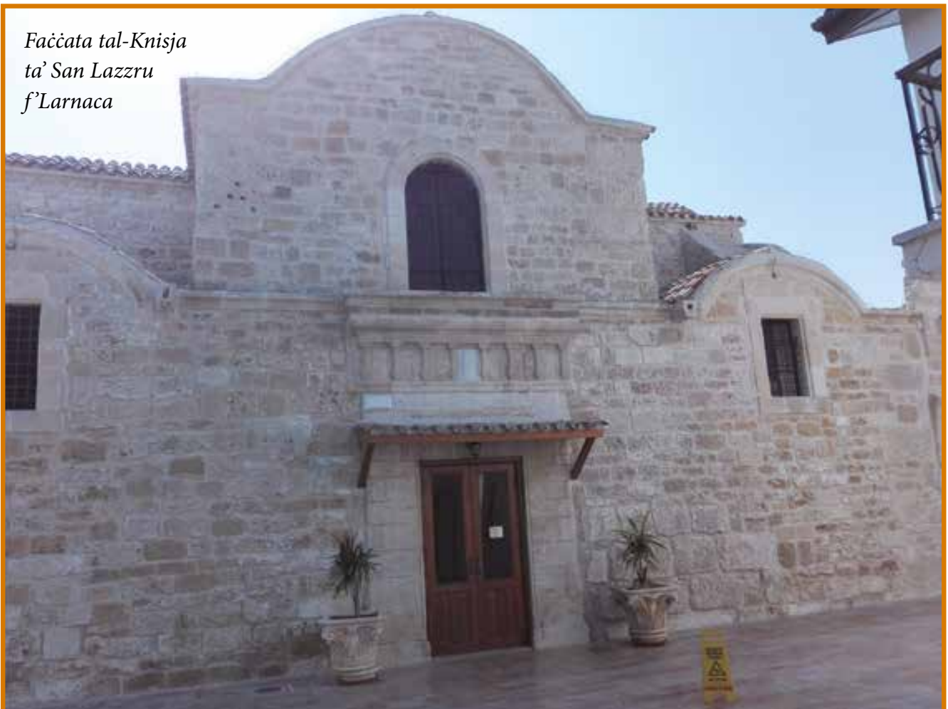
Faċċata tal-Knisja ta' San Lazzru f'Larnaca

Il-knisja ta' San Lazzru f'Larnaca kienet magħrufa mill-qedem. Il-pellegrini lejn l-Art Imqaddsa, li kienu jbahħru u jieqfu Ċipru, kienu jqisu l-knisja ta' San Lazzru f'Larnaca bħala parti