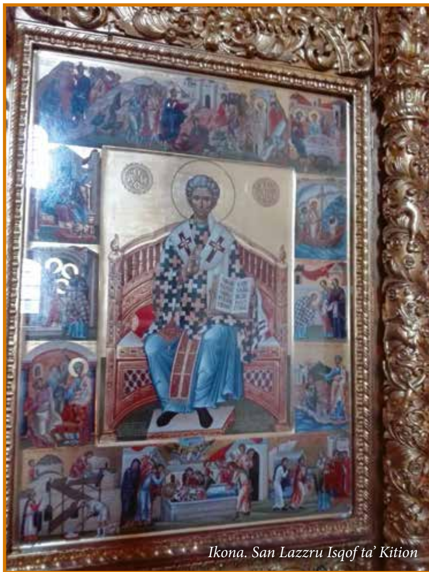
Ikona. San Lazzru Isqof ta' Kition

kellu jaffaccja zewg perikli kbar għall-fidi Kristjana. L-ewwel periklu kien ġej mir-religjon pagana, li kienet ibbazata fuq il-kult idolatriku tal-alla femminili Afrodite, li Ċipru kienet magħrufa għalih billi jingħad li Afrodite, alla tal-imħabba erotika, twieldet fil-mewg tal-kosta tan-nofsinar ta' Ċipru, bejn Limassol u Pafos, fejn sal-lum it-turisti jieqfu biex jammiraw il-blata ta' Afrodite b'tifkira ta' din il-leggenda. It-tieni periklu, li nafu bih mir-rakkont tal-Atti tal-Appostli dwar il-migja ta' Pawlu u Barnaba