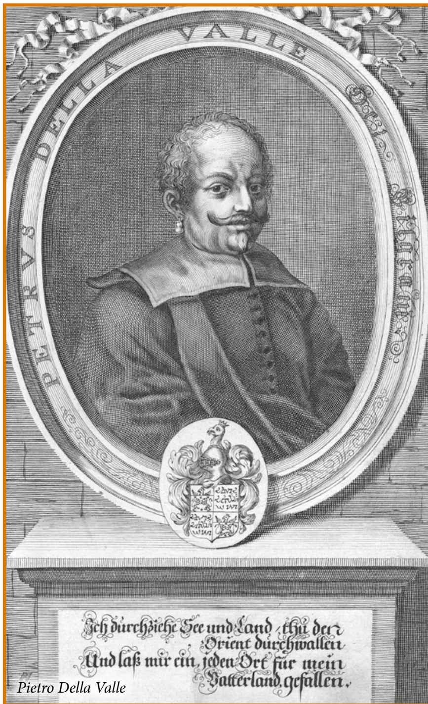
Pietro Della Valle

integrali mill-pellegrinaġġ tagħhom fl-Art Imqaddsa. F'dan il-post insibu xhieda ta' bosta mirakli ta' fejqan li sehħew bl-interċessjoni ta' San Lazzru, kif jikteb Pietro Della Valle, nobbli Ruman li żar Larnaca fl-1614-1626, li jgħid li għalkemm hemm dubji dwar jekk San Lazzru ġiex verament Ċipru, imma din il-verità hi ppruvata mill-mirakli li l-Qaddis iwettaq ta' kuljum f'din