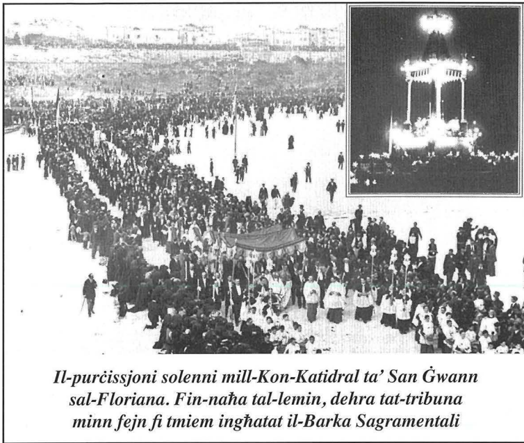
Il-purċissjoni solenni mill-Kon-Katidral ta' San Ġwann sal-Floriana. Fin-naħa tal-lemin, dehra tat-tribuna minn fejn fi tmiem inġhatat il-Barka Sagrimentali

jitkanta sal-lum u li gie tradott f'diversi ilsna barranin. Tifkira ta' dan il-kungress, hija l-istatwa artistika ta' Kristu Re fil-Floriana, xogħol ta' Antonio Sciortino u waħda mit-toroq ewlenin tal-Mosta li ssemmiet proprju għal dan l-avveniment, Triq il-Kungress Ewkaristiku.