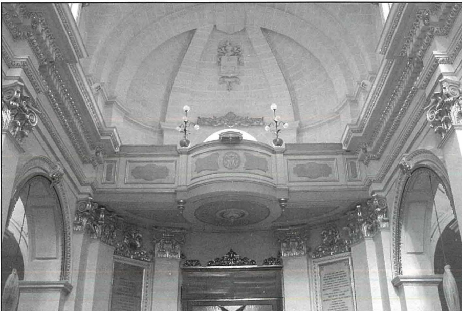
Il-gallarija tal-orgni fil-knisja parrokkjali ta' Had-Dingli