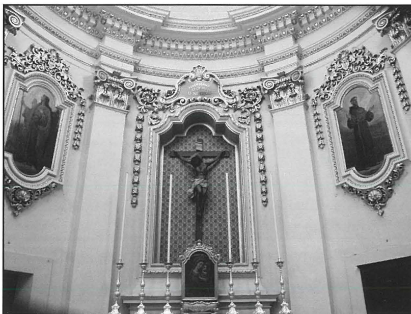
Il-kwadri ta' San Franġisk t'Assisi u tal-Arkanġlu San Rafel fil-knisja parrokkjali ta' Had-Dingli.

Xogħlijiet oħra ta' Monti f'pajjiżna jinsabu fi tliet lokalitajiet Ghawdxin. L-akbar wirt li dan l-artist ta' fama halla f'din il-gżira jinsab fil-knisja bażilika ta' Marija Bambina fix-Xagħra fejn hu l-awtur tal-pitturi kollha fis-saqaf, fin-navi u fl-altari, minbarra wahda. Għall-knisja parrokkjali ta' Kerċem pittur il-kwadri ta' żewġ altari: wiehed juri l-Qalb Imqaddsa ta' Ġesù u iehor il-Madonna tal-Karmnu, waqt li fiż-Żebbuġ hu l-awtur ta' kwadru li juri l-Familja Mqaddsa.