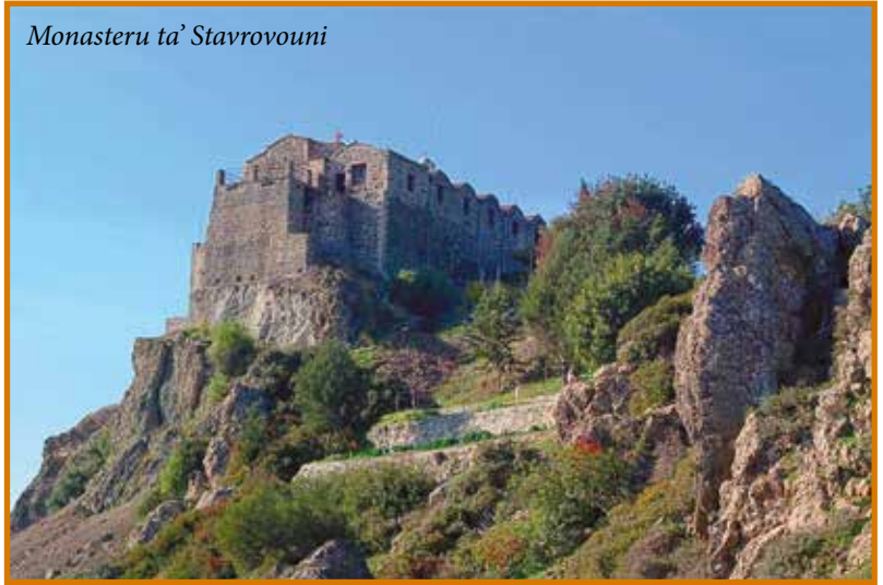
Monasteru ta' Stavrovouni

stil ta' hajja komuni bhall-Monasteri ta' Monte Athos, u għaldaqstant il-monaci jghixu hajja iebsa ta' talb u penitenza. Il-monasteru kien antikament interdett għan-nisa, imma llum il-ġurnata hu miftuħ għall-viżitaturi f'ċerti hinijiet u żminijiet.