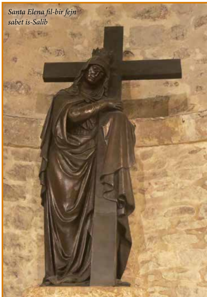
Santa Elena fil-bir fejn sabet is-Salib

Tradizzjoni antikissima f'Ċipru tgħid li Stavrovouni hu wiehed mill-eqdem monasteri tad-dinja. Dan il-monasteru twaqqaf minn Santa Elena, omm l-Imperatur Biżantin Kostantinu I l-Kbir. Il-kronista Ċiprijota tas-seklu 15, Leontios Makhairas, jikteb li fi tmiem l-ewwel Sinodu (Konċilju) Ekumeniku ta' Nicea (325), Elena marret f'pellegrinaġġ lejn l-Art Imqaddsa, fejn hi skopriet l-għuda tal-veru