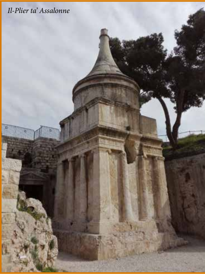
Il-Plier ta' Assalonne

Iskandlu, t-triq tibqa' niezla lejn Ain Roghel u l-qiegh tal-wied li jkompli lejn id-deżert bl-isem ta' Wadi Nar sa ma jispiċċa fil-Baħar il-Mejjet. It-triq tibda wkoll tiela' fuq ix-xaqliba l-oħra, lejn il-parti aktar għolja tal-Wied tal-Kedron. Kienet din it-triq li ħadu Ġesù u l-Appostli nhar Ħamis ix-Xirka, meta marru fil-Ġetsemani.