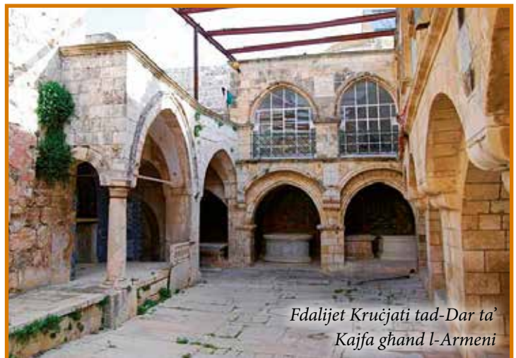
Fdalijiet Kruċjati tad-Dar ta' Kajfa għand l-Armeni

Nafu li l-palazzi u d-djar ta' nies għonja f'Ġerusalem ta' żmien Ġesù kienu jinsabu